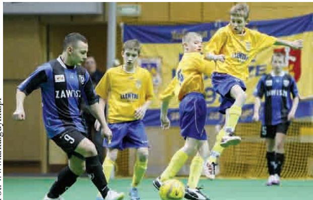
Impreza na pewno na stałe zagości w piłkarskim kalendarzu