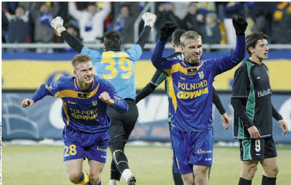
Kibice gdyńskiej Arki mają nadzieję, że w piątek piłkarze tak będą się cieszyli po wygranym spotkaniu z Wisłą Kraków