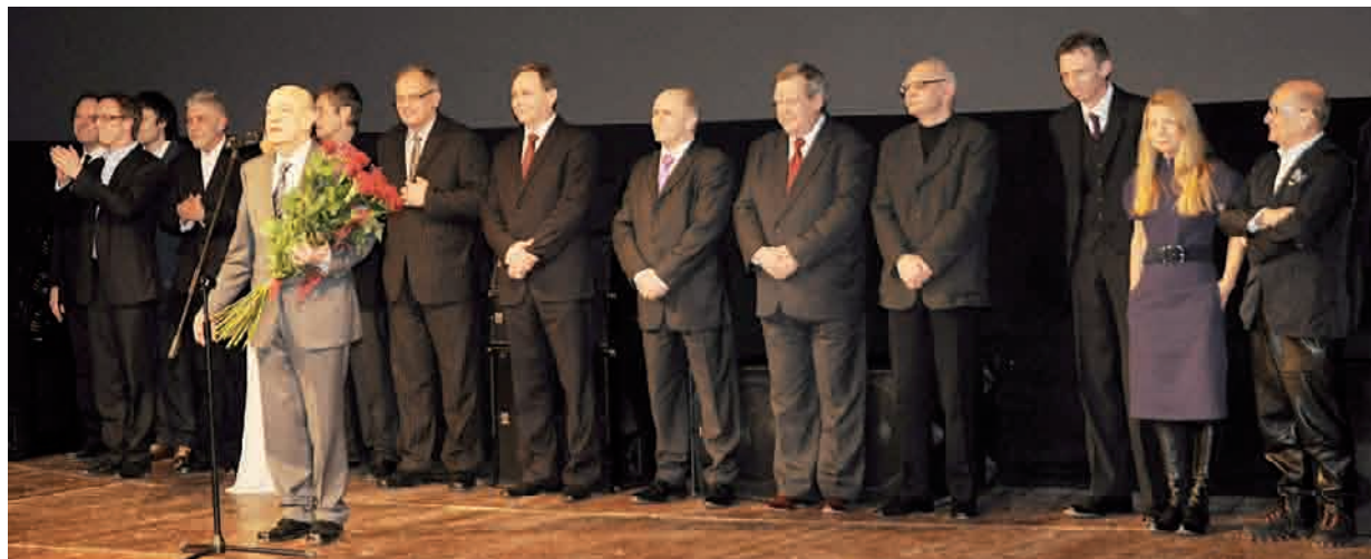
Twórcy filmu Czarny Czwartek na scenie tuż przed rozpoczęciem premierowego pokazu

W poniedziałek w Warszawie odbyła się uroczysta premiera filmu Czarny Czwartek w reżyserii Antoniego Krauze.