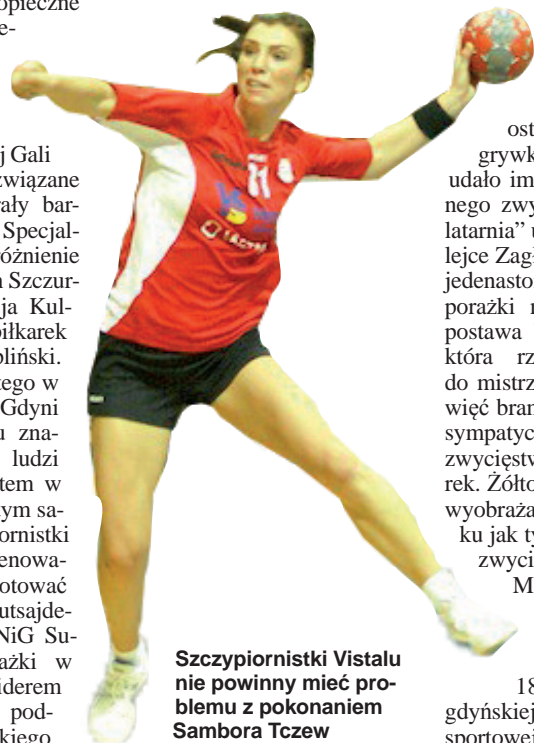
Szczypiornistki Vistalu nie powinny mieć problemu z pokonaniem Sambora Tczew