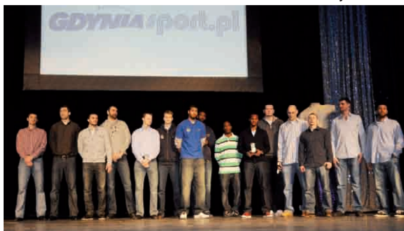
Drużyna koszykarzy Asseco Prokom