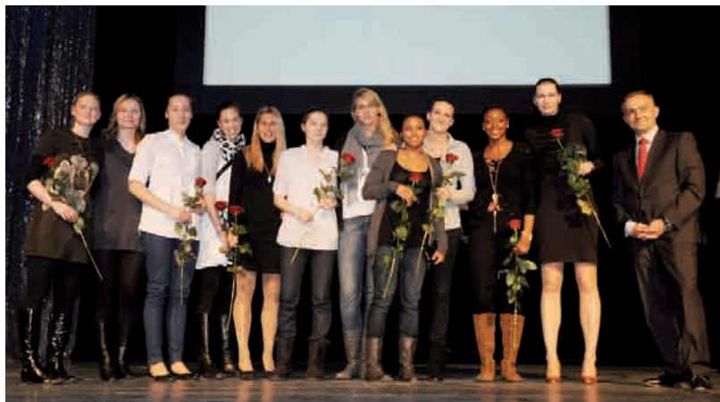
Koszykarki LOTOS-u najlepsza żeńska drużyna