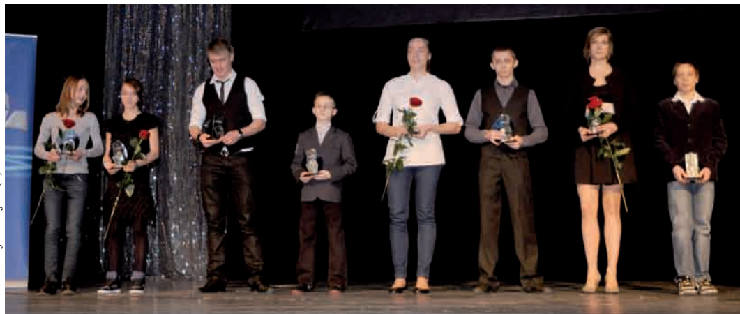
Nadzieje gdynńskiego sportu