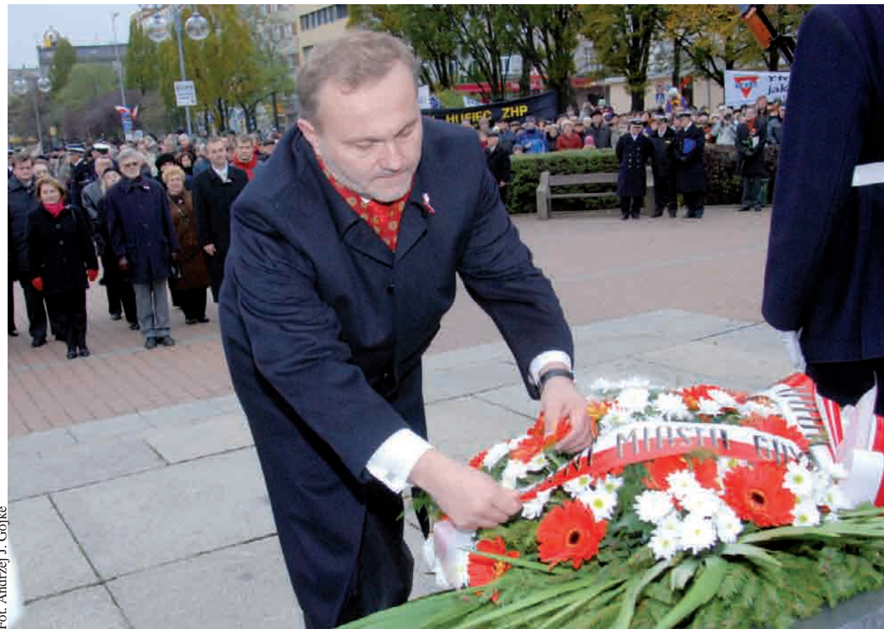
Tradycyjnie już jednym z elementów obchodów urodzin Gdyni, jest złożenie kwiatów na Płycie Marynarza Polskiego

Niezwykle uroczystości zapowiadają się obchody 85. rocznicy nadania Gdyni praw miejskich. Oprócz stałych, corocznych wydarzeń dla mieszkańców Gdyni i gości organizatorzy przygotowali szereg atrakcji i niespodzianek.