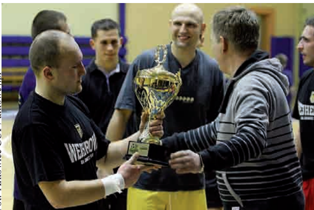
Była to już trzecia edycja turnieju kibiców Arki Gdynia

W gdyńskiej hali stawiło się aż 30 zespołów, które podzielone zostały na trzy grupy. Z każdej grupy do dalszej fazy awansował zwycięzca oraz dwa zespoły z drugich miejsc z najlepszym bilansem. Kibice mieli okazać mnóstwo zaciętych pojedynków – mimo, że to towarzyski turniej. Kolejna faza wyłoniła komplet półfinałistów, których stanowili: Cisowa, Oksywie, Dąbrowa i Wejherowo. W pierwszym z półfinałów po zaciętym meczu Cisowa wygrała w karnych z Oksywem, natomiast w drugim Wejherowo ograło 3:0 Dąbrowę. W wielkim finale spotkały się reprezentację Cisowej i Wejherowa. Mimo iż drużyna Oksywia