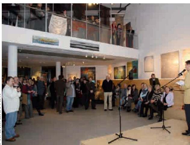
Otwarcie wystawy pokonkursowej poprzedniej edycji w Muzeum Miasta Gdyni

Odbywające się co dwa lata cykliczne konkursy, dają artystom czas na przygotowanie ciekawych wielkoformatowych prac o wybitnych walorach artystycznych. Na