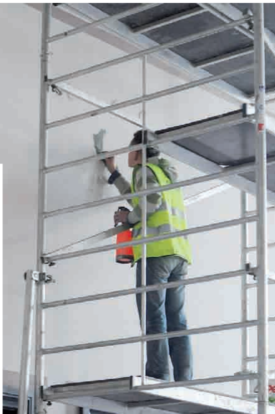
Z dotychczas odkrytych fragmentów widać, że przedstawiają one m. in. mapy z nazwami polskich miast