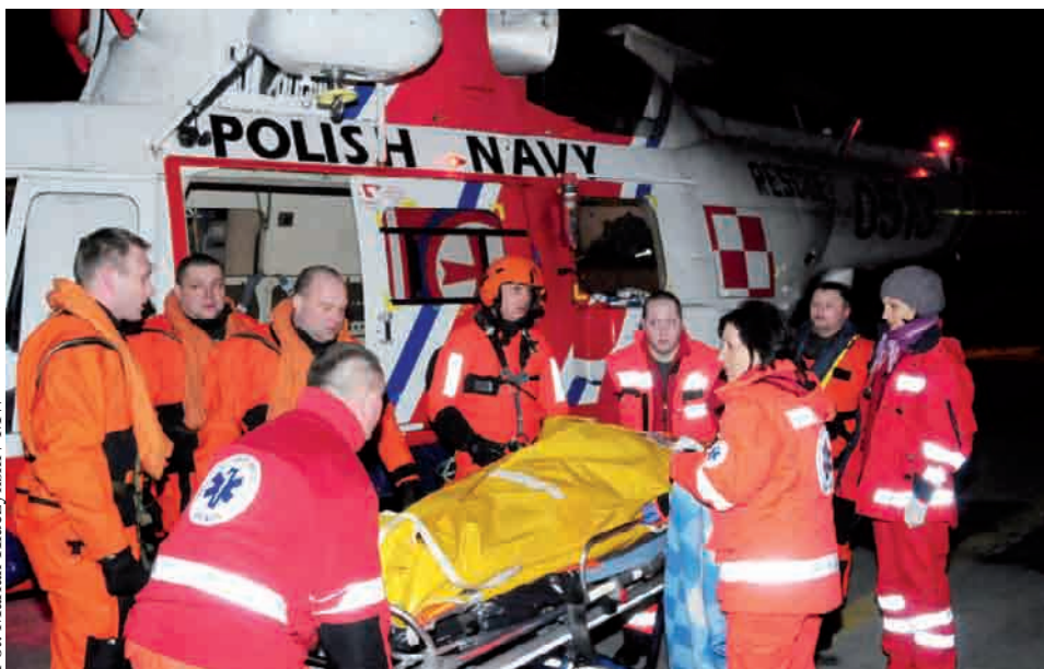
Na lotnisku MW chory został przekazany obsadzie karetki pogotowia

- Do akcji skierowany został dyżurujący w Gdyni śmigłowiec ratowniczy W-3RM „Anakonda” z 43 Bazy Lotnictwa Morskiego – informuje kpt. mar. Grzegorz Lyko z Biura Prasowego MW. - Dowodzona przez por. mar. pil. Adama Sołopę załoga otrzymała zadanie podjęcia chorego z pokładu promu i przetransportowania na lotnisko MW w Gdyni Babich Dołach. O godzinie 18:00 chory został podjęty na pokład śmigłowca, gdzie znalazł się pod opieką lekarza pokładowego por. mar. lek.