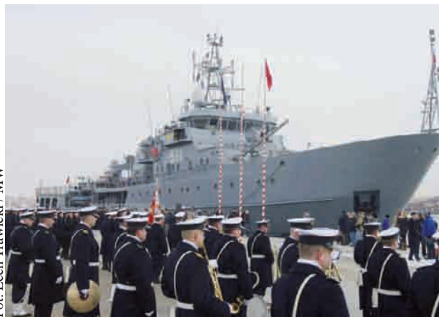
ORP „Kontradmiral Xawery CZERNICKI” rozpocznie w piątek półroczną misję pod flagą Sojuszu Północnoatlantyckiego

- Marynarka Wojenna jest pierwszą i jak dotąd jedyną spośród sił morskich państw przyjętych do NATO po 1999 roku – powiedział dowódca Marynarki Wojennej RP, - której powierzono tak odpowiedzialne zadanie.