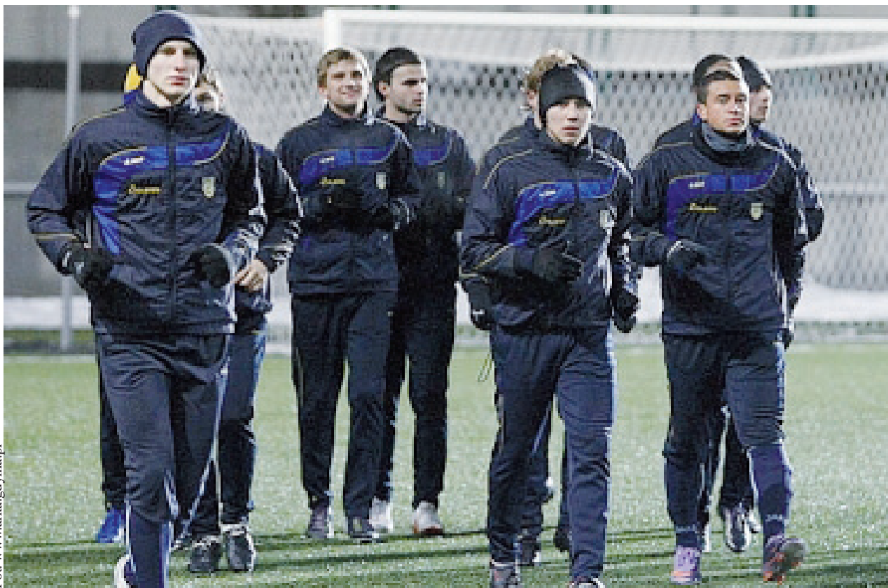
Arka Gdynia nie zwalnia tempa w przygotowaniach do rundy rewanżowej ekstraklasy. Od środy piłkarze przebywają w Turcji

Od środy piłkarze do rundy wiosennej przygotowywać się będą w Turcji, gdzie zagrają aż cztery spotkania kontrolne – dwa z zespołami z Białorusi, jeden z drużyną łotewską, a ostatni zagrają z ekipą ze Słowacji. Pierwsze spotkanie już