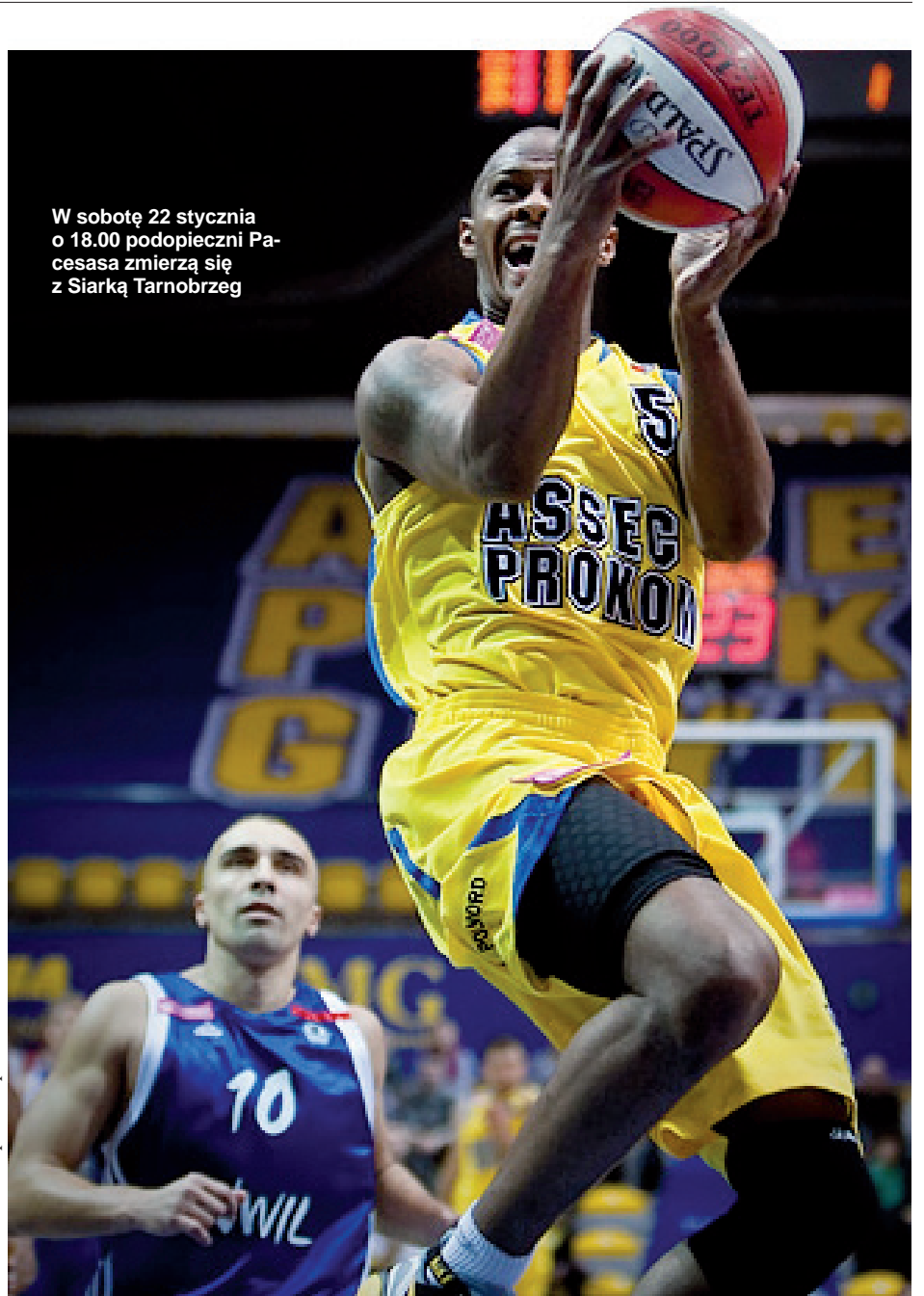
W sobotę 22 stycznia o 18.00 podopieczni Pacesasa zmierzą się z Siarką Tarnobrzeg