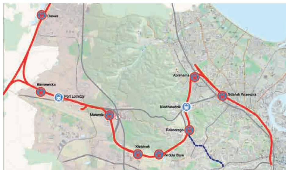
Mapka nowej linii w wariantie zarekomendowanym przez Zarząd Województwa

20-kilometrowa linia Pomorskiej Kolei Metropolitalnej będzie w całości dwutorowa i zelektryfikowana. Wybrany spośród 16 projektów wariant W3BE4 został przez ZWP rekomendowany jednogłośnie.