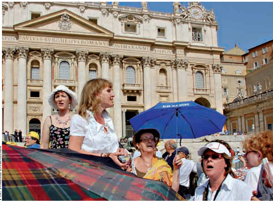
Pielgrzymi z Polski będą z pewnością stanowić najliczniejszą reprezentację narodową

- W naszej parafii wszystkie miejsca w autokarze rozeszły się błyskawicznie – usłyszeliśmy w kancelarii Parafii Przemienienia Pańskiego w Gdyni Ciszewej. – Cena za pięciodniowy wyjazd nie jest mała i wynosi około 1800 zło-