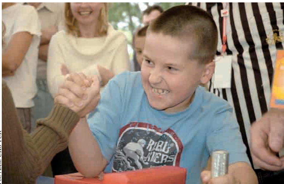
Zajęcia zimowej szkoły armwrestlingu poprowadzi UKS TUR

Tradycyjnie już niezwykle rozbudowaną ofertę darmowych zajęć sportowo - rekreacyjnych, z myślą o młodych gdyńsiakach przygotował Gdyński Ośrodek Sportu i Rekreacji.