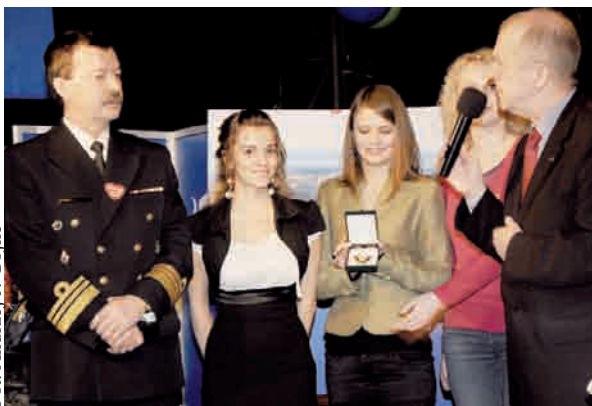
Licytacja serca w Teatrze Muzycznym