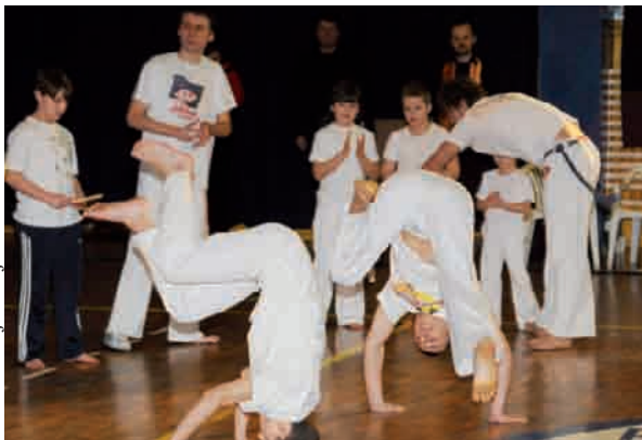
Pokazy Capouere w gdyńskiej YMCE