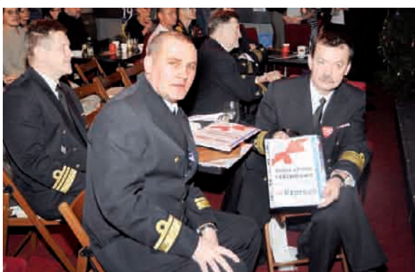
Reklamy w Expressach wylicytowała AMW