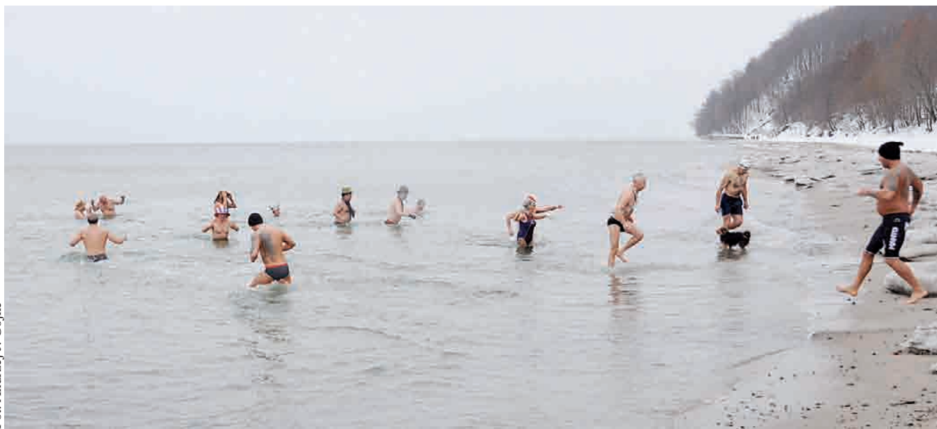
Gdyńskie Morsy powitały Nowy Rok kąpielą w zimnym Bałtyku