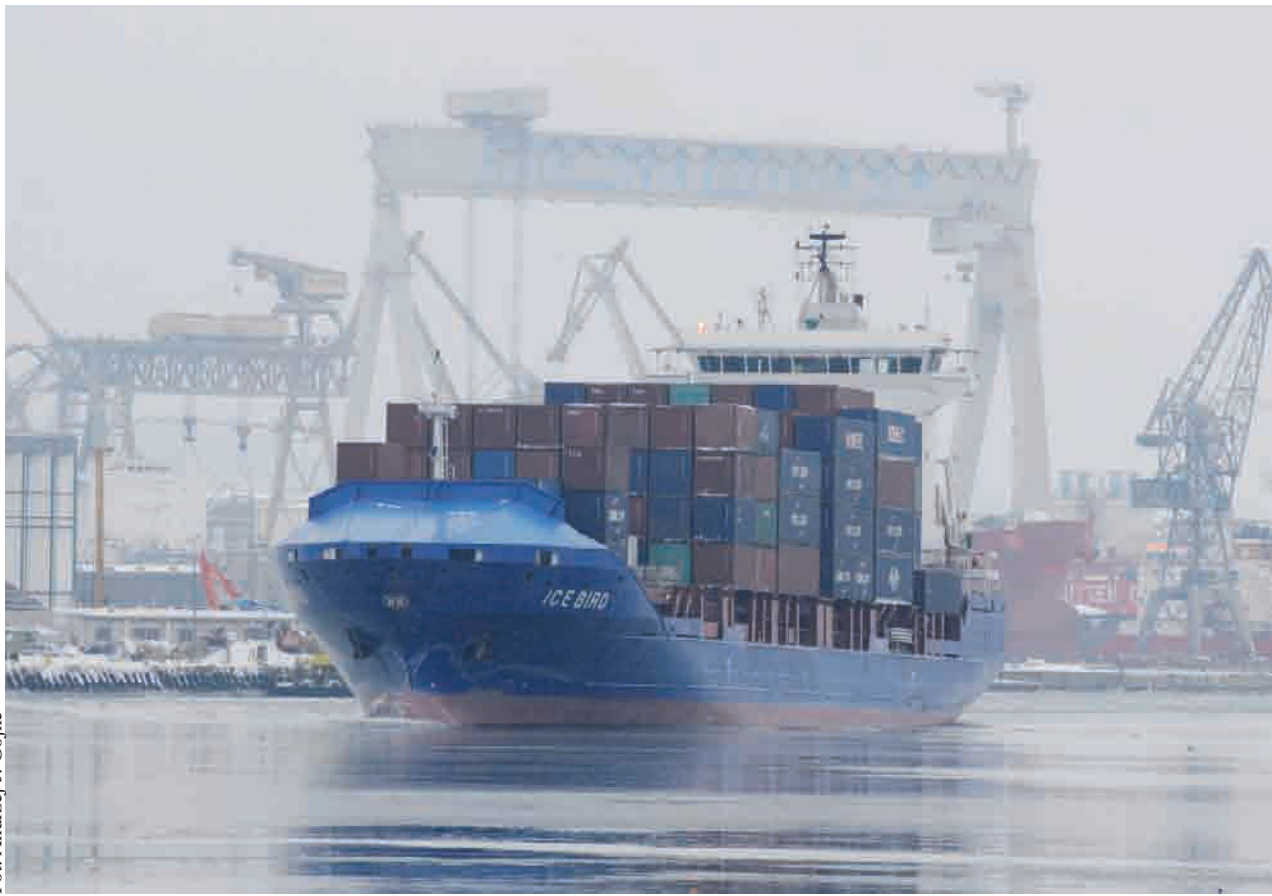
Port w Gdyni jest pozbawiony tras komunikacyjnych, odpowiadających normom unijnym, co ma niekorzystny wpływ na rozwój społeczno - gospodarczy miasta i regionu

Do końca stycznia 2011 zapisać mają ostateczne decyzje rządowe w sprawie programu budowy dróg w latach 2011-2015. W dotychczasowym projekcie rządowym nie znalazła się bardzo ważna dla rozwoju regionu, a szczególnie gdyńskiego portu inwestycja, jak budowa Obwodnicy Północnej Aglomeracji Trójmiejskiej (OPAT), budowa drogi będącej przedłużeniem ul. Janka Wiśniewskiego od Trasy Kwiatkowskiego w Gdyni do OPAT oraz modernizacja drogi stanowiącej przedłużenie ul. Polskiej od skrzyżowania z ul. Chrzanowskiego do Dworca Morskiego w Gdyni. Wymienione inwestycje to brakujący odcinek sieci drogowej TEN-T (Transeuropejska Sieć Transportowa, łączącej terminale portu morskiego w Gdyni z siecią TEN-T dochodzącą do granic miasta. W związku tym samorządy Gdyni, Rumi, Redy, Wejherowa oraz Kosakowa postanowiły wspólnie wystąpić z wnioskiem do Ministerstwa Infrastruktury o wpisanie tych do rządowego programu. W uzasadnieniu wniosku można przeczytać m. in. że obecnie „Port w Gdyni jest pozbawiony tras komunikacyjnych, odpowiadających normom unijnym, co ma niekorzystny wpływ na rozwój społeczno - gospodarczy miasta i regionu,