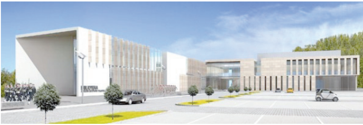
Wizualizacje biblioteki z centrum audytoryjno – informacyjnym, która ma zostać oddana do użytku we wrześniu 2012 roku