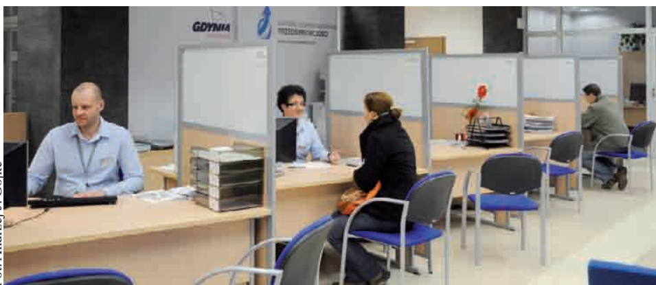
Formularze zgłoszeniowe otrzymać można m. in. w siedzibie Gdyńskiego Centrum Wspierania Przedsiębiorczości

Dziewiąta edycja konkursu „Gdyński Biznesplan 2010” rozpoczęła się 3 stycznia. Adresowany jest on przede wszystkim do osób, które nie rozpoczęły jeszcze działalności gospodarczej, a także do działających już małych przedsiębiorstw.