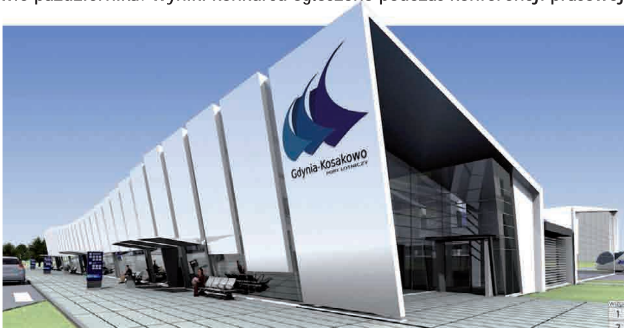
Wizualizacja zwycięskiej koncepcji architektonicznej terminala General Aviation

Projekt architektonicznej koncepcji terminala General Aviation - przyszłego Portu Lotniczego Gdynia - Kosakowo" - autorstwa zespołu ATI Sp. z o.o. z Warszawy jednogłośnie zwyciężył jednogłośnie w konkursie ogłoszonym w połowie października. Wyniki konkursu ogłoszono podczas konferencji prasowej w Muzeum Miasta Gdyni.