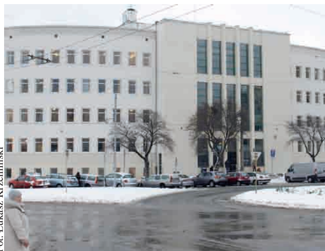
Po kilku latach starań udało się w końcu przeprowadzić remont budynku

Oficjalnie zakończenie prac i podsumowanie remontu odbyło się 17 grudnia w sali głównej Sądu przy pl. Konstytucji 5. Oprócz członków Stowarzyszenia „Zabytkowa Gdynia” wzięli w nim udział także przedstawiciele Sądu Okręgowego w Gdańsku oraz władz miasta Gdynia, które to w 75 procentach pokryło koszty remontu szacowanego na 520 tys. zł. Warto zaznaczyć, iż w mijającym roku miasto Gdynia przeznaczyło ponad 1 milion złotych na konserwa-