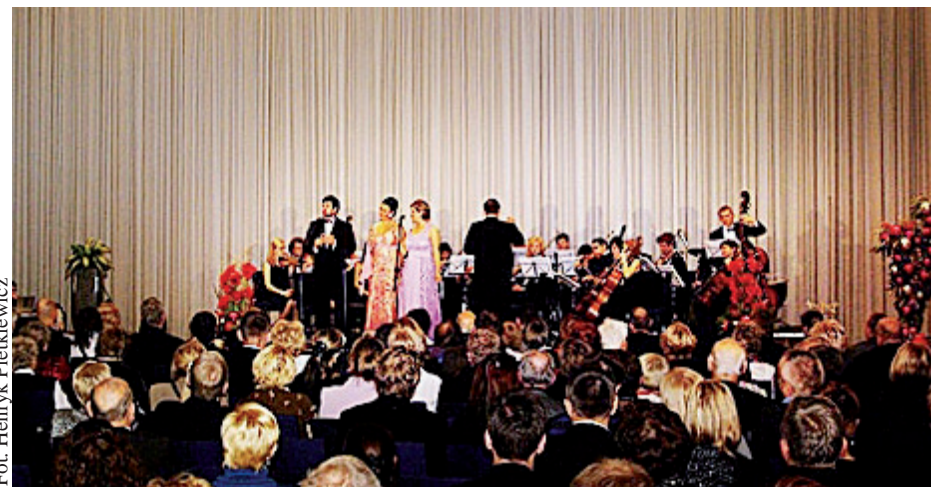
Podczas Gali Noworocznej 1 stycznia 2010 roku w sali Columbus w Hotelu Sheraton

Z wielką radością chcemy poinformować Czytelników Expressu, że po ogromnym sukcesie Gali Noworocznej, która odbyła się 1 stycznia br. w Hotelu Sheraton w Sopocie, agencja IMRESSIO Art Management, wspólnie z prezydentem Miasta Sopotu oraz operatorem sieci PLUS postanowili przygotować drugą edycję imprezy. Koncerty odbędą się 1 stycznia 2011 roku o godz. 16. oraz 19.