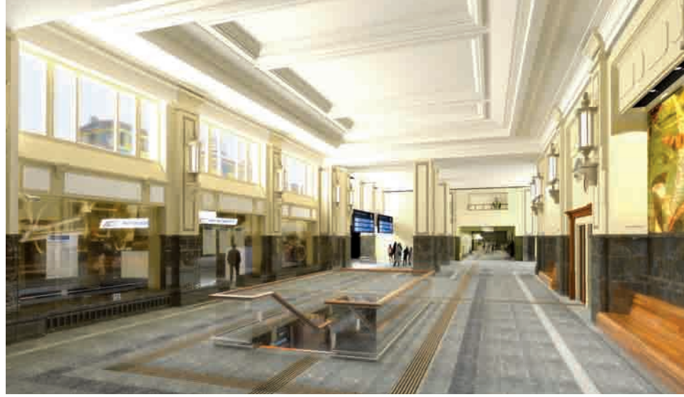
Niedostępne wcześniej pomieszczenia piwniczne zostaną zaaranżowane na dodatkowe poczekalnie, skrytki bagażowe i toalety dla pasażerów

miczne. Renowacji poddana zostanie mała architektura wokół budynku dworca. Przestrzeń nowego dworca kolejowego w Gdyni zaaranżowana ma być w sposób przyjazny dla pasażerów. W centrum obsługi podróżnych nie zabraknie, bankomatów, kiosków prasowych, kafejek czy restauracji. Zamontowane zostaną schody ruchome i windy, nowoczesny system informacji wizualnej oraz monitoring wewnątrz i na zewnątrz budynku. Cały obiekt przystosowany będzie oczywiście dla obsługi osób niepełnosprawnych. Przebudowa dworca kolejowego Gdynia Główna prowadzona jest dzięki środkom Programu Operacyjnego Infrastruktura i Środowisko Unii Europejskiej i kosztuje 40,7 mln złotych. Od niedawna działa nowa strona internetowa dworca, na której, odnaleźć można historię dwóch poprzedników obecnego dworca, ak-