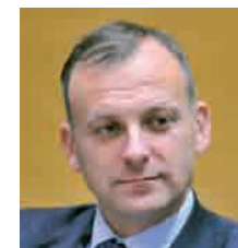
Michał Guć Wiceprezydent