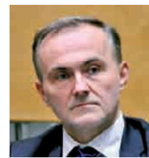
Wojciech Szczurek Prezydent Gdyni