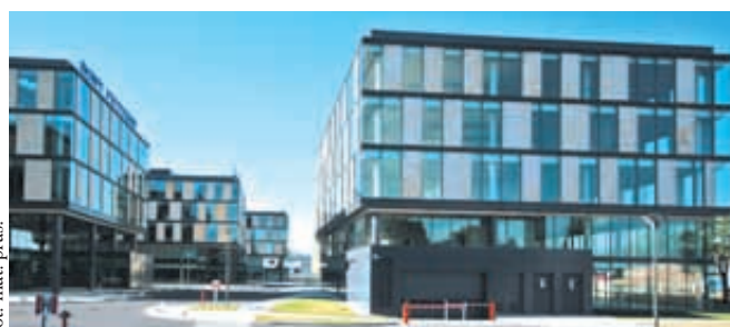
for. mat. pras.

Badanie opinii dotyczyło szerokiego zakresu oceny, m. in. projektu architektonicznego, standardu ekologicznego budynku, komfortu pracy, jakości wykończenia, standardu technicznego, parkingu, udogodnień dla pracowników, jakości usług objętych ryczałtem miesięcznym, stawki czynszu najmu. Oprac. DK