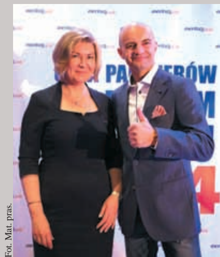
fol. Mat. pras.