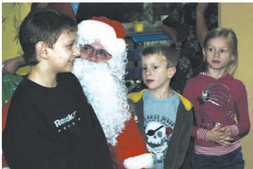
Grzeczne dzieci odwiedził gość specjalny

„Wigilia pamięci pokoleń” odbyła się w Zespole Szkół nr 14.