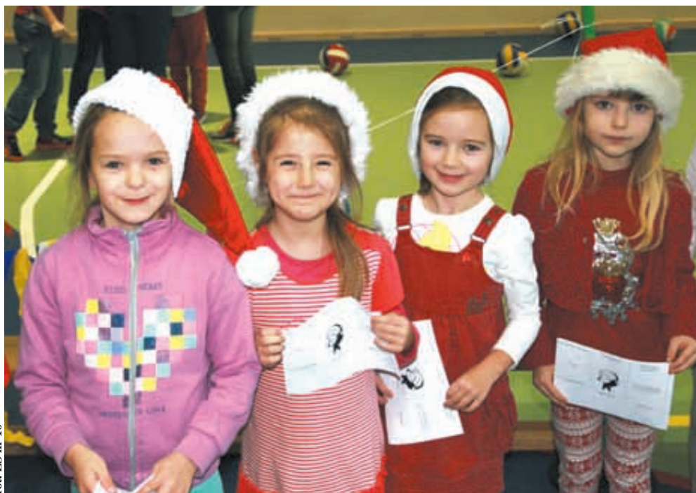
Uśmiechy na twarzach były potwierdzeniem dobrej zabawy

- Nie od dzisiaj wiadomo, że dzieci, które w szkole czują się dobrze i odbierają ją jako miejsce, które oprócz wyťažonej pracy gwarantuje dobrą zabawę, osiągają lepsze wyniki w nauce od tych