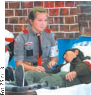
Dzieciaki z zaangażowaniem wcieliły się w role

Młodzież z Zespołu Szkół nr 13, w ramach realizowanego projektu edukacyjnego „Nie możemy o nich zapomnieć”, przygotowała niecodzienny spektakl.