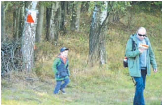
Poprzednia edycja rajdu miała miejsce w Sierakowicach

Organizatorzy przygotowali trzy trasy do wyboru: Smerfową (7,5 km), Zieloną (15 km) i Czarną (15 km). Na miejscu oprócz rywalizacji na trasach liczne atrakcje: ognisko, pyszne jedzonko, losowanie zjazdów „tyrolek”, spotkanie z Tajemniczym Gościem. Każdy uczestnik otrzyma w pakiecie starto-