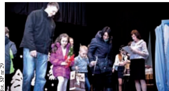
fol. SP nr 29

Wszystkich uczestników konkursu organizatorzy zapraszają na uroczystą świąteczną galę, która odbędzie się