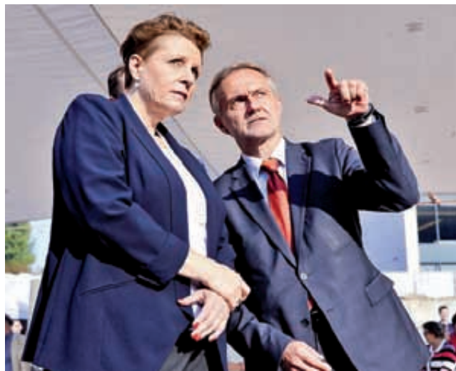
Małgorzata Omilanowska, minister kultury i dziedzictwa narodowego oraz Wojciech Szczurek, prezydent Gdyni

Po zaledwie trzech miesiącach budowy, nad Gdyńskim Centrum Filmowym zawisła wiecha. Celuloidowa - jak przystało na inwestycję związaną z filmem.