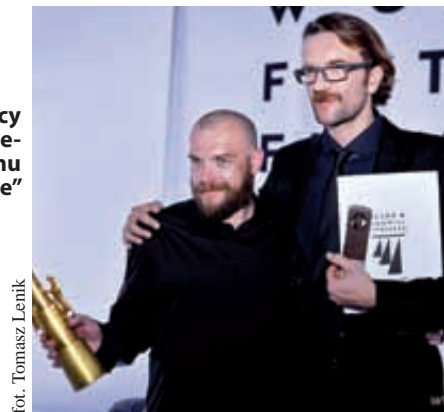
fol. Tomasz Lenik

Na Festiwalu Filmowym w Gdyni w konkursie głównym zaprezentowano 13 filmów. Jury, pod przewodnictwem Ryszarda Bugajskiego, przyznało „Srebrne Lwy” twórcom filmu „Pod Mocnym Aniołem” w reżyserii Wojciecha Smarzowskiego.