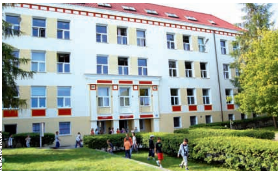
SP nr 20 to jedna z najstarszych tego rodzaju placówek w Gdyni