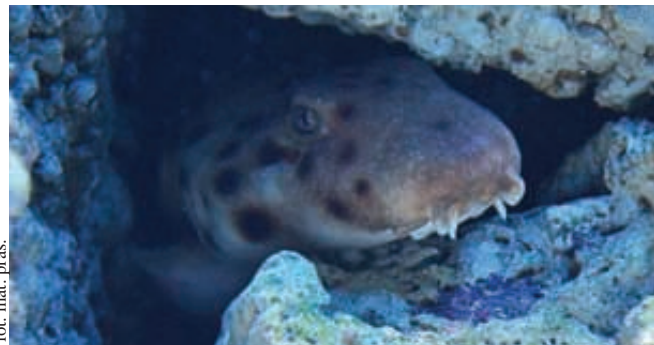
Rzadki okaz - tzw. rekin „chodzący”

coś dla siebie. Wydarzenia specjalne podczas Tygodnia Rekina zostaną podzielone na dwa weekendy, więc najczęściej atrakcji czeka gość w soboty i niedziele. Będą wykłady poświęcone rybam chrzęstnoszkieletowym, czyli zwierzętom, które żyją na ziemi od ponad 400 milionów lat. Warto zobaczyć ryby, kiedy w ich akwarium pojawi się jedzenie, bo ich zachowanie bywa w takich momentach nieprzewidywalne.