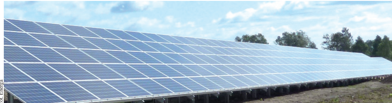
Panele na gdańskiej farmie zajmują większą powierzchnię niż trzy pełnowymiarowe boiska piłkarskie

Farma fotowoltaiczna usytuowana na granicy Gdańska i Przejazdowa zbudowana została z 6292 paneli o łącznej mocy 1,636 MWp. Ułożono je w pięciu równoległych rzędach na powierzchni około 25 tys. metrów kw., czyli większej niż zajmują trzy pełnowymiarowe boiska piłkarskie. Według wstępnych szacunków instalacja będzie produkować około 1,5 GWh energii rocznie, co pozwoli zaspokoić zapotrzebowanie około 720 przeciętnych gospodarstw domowych. Koszt inwestycji wyniósł blisko 9,5 mln zł, a prace budowlano montażowe