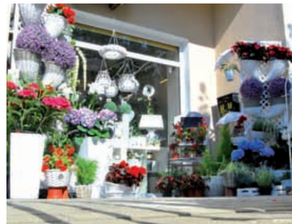
Rywalizowano w kilku kategoriach

Wyróżnienia poprzez publikację w internecie na stronie www.gdynia.pl dostali: Żłobek „Niezapominajka” przy ul. Wójta Radtkego 23 oraz Pracownia Florystyczna „Karolinka” przy ul. Legionów 115 B/1. Wręczenie nagród nastąpi 27 września, podczas imprezy plenerowej „Dary Ziemi i... Europa od kuchni” w Parku Kolibki. Oprac. DK