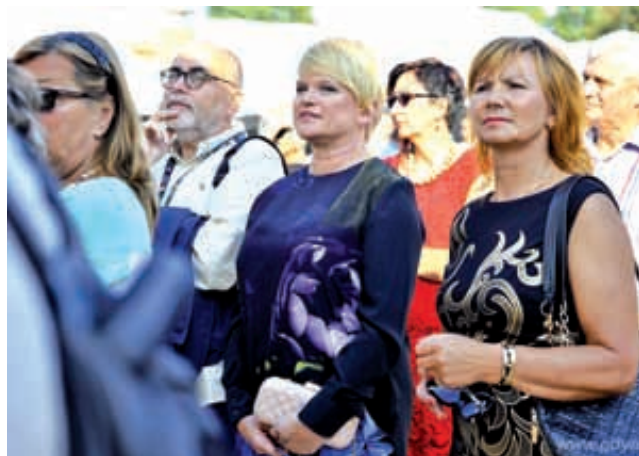
Nie zabrakło osób związanych od lat z polskim filmem