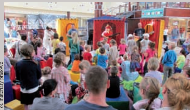
Przedstawienia teatralne, które co miesiąc odbywają się w Port Rumia cieszą się bardzo dużym zainteresowaniem dzieci i rodziców

Współczesny klient poszukuje w galerii handlowej czegoś więcej, niż tylko atrakcyjnej oferty zakupowej. Wybiera się na zakupy często w towarzystwie rodziny czy najbliższych – chciałby znaleźć w galerii przestrzeń, która sprzyja odpoczynkowi. Stąd obecność najmocnych takich jak księgar-