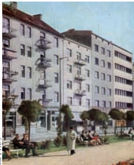
Na Skwerze Kościuszki powstała pierwsza w Gdyni księgarnia. Muzeum Miasta Gdyni

wana z funduszu miejskiego. Otrzymała nazwę „Biblioteki Miejskiej”. W kwietniu 1935 r. Komisarz Rządu w Gdyni przemianował ją na Miejską Bibliotekę Publiczną w Gdyni z księgozbiorem 4 tys. woluminów, korzystało z niej 200 czytelników” 3 . Miejska Biblioteka z początku była konkurencją dla prywatnych placówek do czasu gdy okazało się, że dysponują zasobniejszym składem książkowym. W sumie biblioteki miejskie i prywatne uzupełniały się, pomimo częściowo dublujących się tytułów. W Gdyni działała lokalna stacja radiowa, która przekazywała wiadomości z Gdyni i okolic. Informowała o przygotowywanych imprezach sportowo - kulturalnych. Jej dziennikarze uczestniczyli w życiu gospodarczym i społecznym: „W 1939 roku otworzono podstację Rozgłośni Pomorskiej Polskiego Radia” 4 .