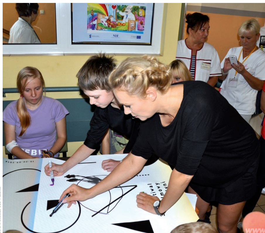
Sonia Bohosiewicz, popularna aktorka, rozweseliła chore maluchy