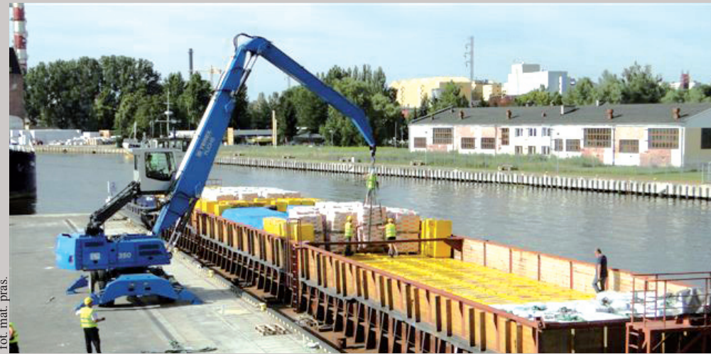
Ubiegły rok był przełomowy dla elbląskiego portu

Aktualnie w ramach rozwoju portu złożone zostały