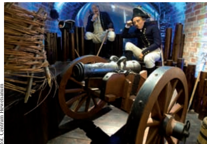
Wystawa „Wehikuł czasu”

Już nie będzie potrzeby, by obserwować w sierpniu noc spadających gwiazd - jeździć do planetarium do Olsztyna czy Torunia. Centrum Hewelianum ogłosiło konkurs na opracowanie koncepcji architektonicznej planetarium wraz z przebudową współczesnej przybudówki do Kaponiery Południowej i rekonstrukcją odcinka muru Carnota. Podstawowym utrudnieniem jest, że planetarium musi znaleźć się pod ziemią. Nie dlatego, że Heweliusz lubił obserwować gwiazdy z piwnicy (choć jako piwowar musiał przebywać w tym przybytku), ale ze względu na wymogi konserwatorskie. Ponieważ cały obszar Fortów jest pod ścisłą pieczęcią konserwatorską, nowe inwestycje mogą powstawać wy-