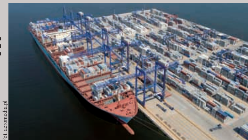
Widok na terminal z lotu ptaka

ton. Najwięcej było towarów drobnicowych (głównie w kontenerach) – 5,63 mln ton, czyli 36,67 % ogółu, następnie ładunków płynnych (Naftoport) – 5,57 mln, czyli 26,2 % całej masy towarowej, węgla przeładowano 1,71 mln ton, innych towarów masowych (głównie zboża) 1,65 mln ton.