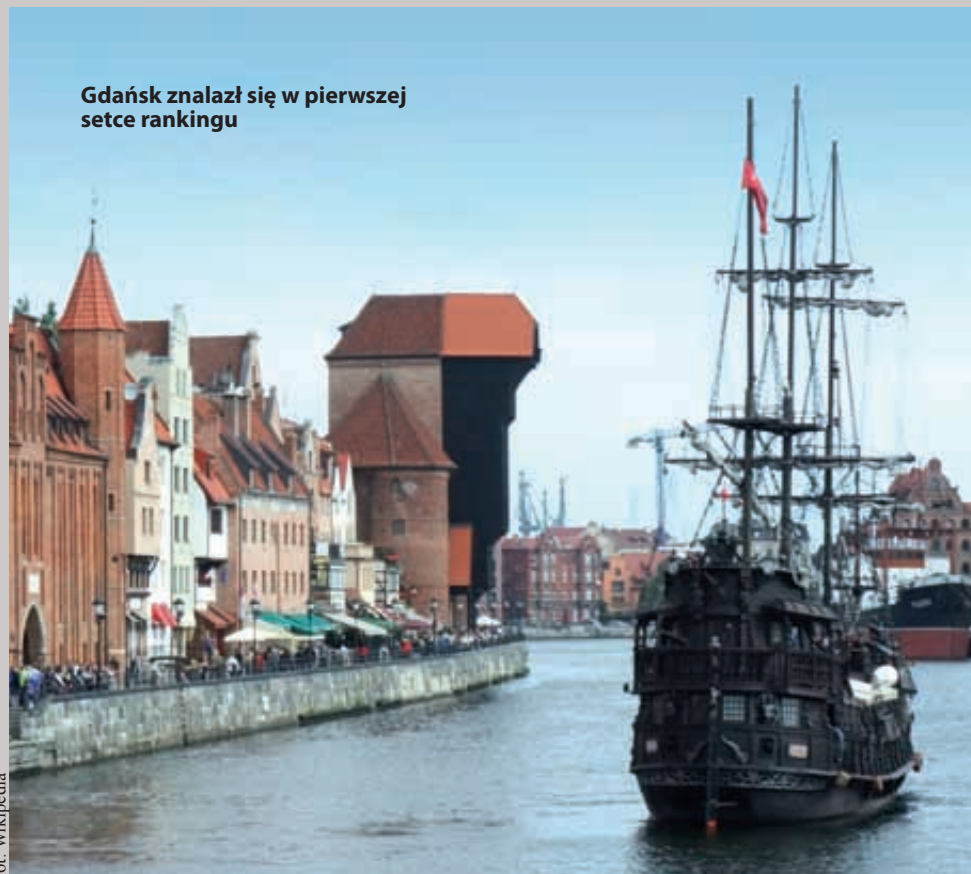
Gdańsk znalazł się w pierwszej setce rankingu

W ostatnim raporcie ICCA (International Congress & Convention Association) Gdańsk, obok Warszawy i Krakowa, znalazł się w pierwszej setce najpopularniejszych europejskich destynacji konferencyjnych.