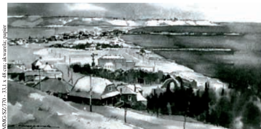
MMG/SZ/370 - 33,1 x 48 cm; akwarela; papier

Gdynia z początku lat 1920; Szczepanek Zbigniew