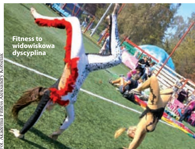
Fitness to widowiskowa dyscyplina