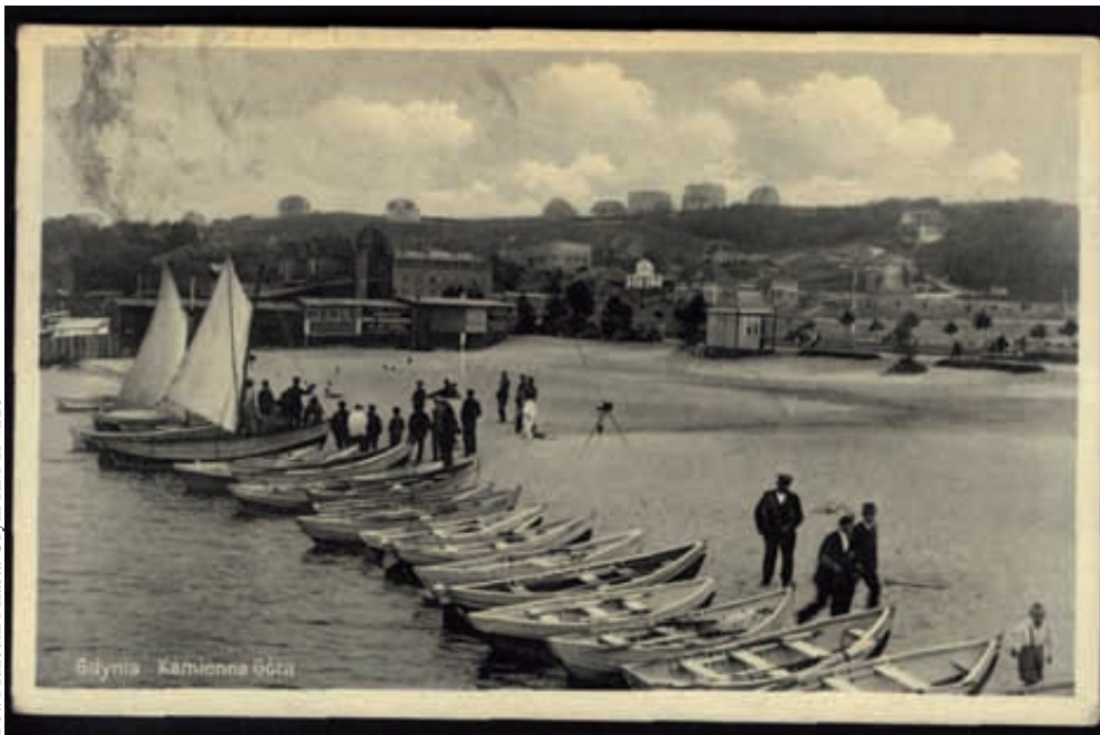
Fot. Muzeum Miasta Gdyni HM-11-426

Niepodważalnym atutem był łatwy dostęp do morza oraz do jego bogactw jakimi były czyste i piaszczyste plaże, które w zachodniej Europie były wówczas rzadkością. Często były organizowane zawody pływackie, których organizatorem był Klub Sportowy „Gryf” ściśle współpracujący z Ligą Morską i Kolonialną. LMiK starała się przygotowywać społeczeństwo do trudnej służby na morzu, w związku z tym organizowano m.in. zmagania pływackie. Zawody pływackie przyciągały liczne rzesze kibiców. Podobnie było, gdy w sportowe szranki stawali marynarze z przycumowanych do oksywskiego brzegu okrętów. Miesiąc sierpień stał pod znakiem zawodów pływackich. Wpierw w konkurencji stanęli zawodnicy rekrutujący się spod znaku kotwicy i bandery wojennej: „Zawody pływackie o Mistrzostwo Floty. Dnia 6 i 7 sierpnia na pływalni W.K.S. „Flota” odbyły się zawody pływackie o mistrzostwo Floty na rok 1937-1938. Rozegrano następujące konkurencje: 100 mtr styl klasyczny; 100 mtr styl dowolny; 100 mtr styl grzbietowy; 300 mtr styl dowolny; 1000 mtr styl dowolny; sztafeta 4x100 mtr styl dowolny” 1 . Pływalnia była