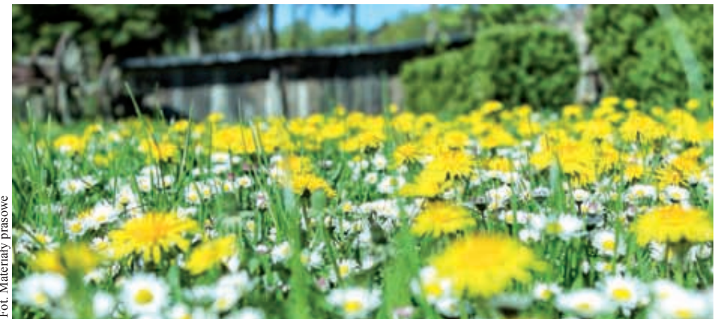
Ogród rozpoczyna się już przy wejściu na posesję - w furtce ogrodzenia, a w zasadzie powiedziałbym, że jeszcze przed ogrodzeniem

Lecz, gdy chcemy sprzedać szybko np. dom, to pomyśl o swojej nieruchomości w spo-