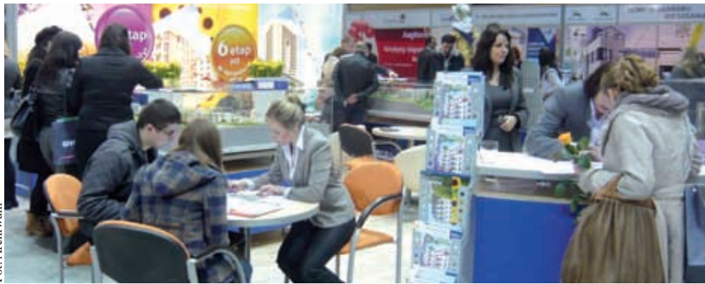
Targi są świetną okazją do przejrzania dużej ilości ofert

Warto więc zarezerwować sobie czas na ten weekend i odwiedzić Amber Expo. Szeroki wybór ofert mieszkań i domów, doradcy finansowi, pośrednicy obrotu nieruchomościami, wartościowe bezpłatne prelekcje to główne atrakcje jesiennej edycji targów. Nie trzeba marnować czasu by odwiedzić biura sprzedaży poszczególnych deweloperów oraz banki – można to zrobić w jednym miejscu i czasie właśnie na targach. Zamiast przeglądać portale i wertować gazety – warto spotkać się bezpośrednio z wystawcami i uzyskać informacje o inwestycji z pierwszej ręki, a nawet wynegocjować rabat!