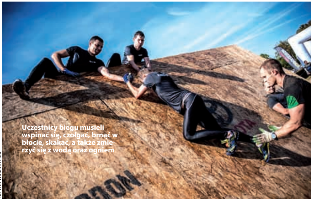
Uczestnicy biegu musieli wspinać się, czołgać, brnąć w błocie, skakać, a także zmierzyć się z wodą oraz ogniem

Runmageddon powróci na Pomorze już na wiosnę, 11 kwietnia na sopockim Hipodromie zostaną rozegrane za-