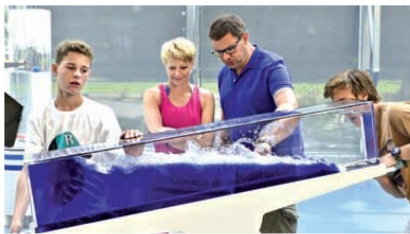
Fot. Materiały prasowe www.experiment.gdynia.pl (4)

czwartek, 11 września 2014 r. Nr 32 (250) NAKŁAD 15 000 EGZ.