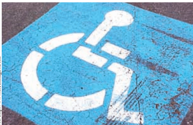
Niepełnosprawni kierowcy parkują na wyznaczonych miejscach

Jak informuje MOPS w Gdyni, od 1 lipca organem wydającym kartę parkingową jest przewodniczący zespołu