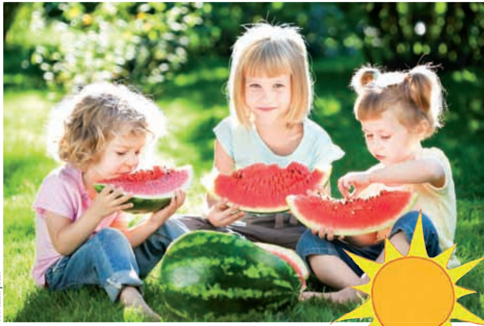
Owoce takie, jak arbuzy to cenne źródło elektrolitów – w sam raz na upały!

Sód, potas, wapń i magnez to pierwiastki, których odpowiedni bilans jest bardzo ważny dla zachowania prawidłowej równowagi wodno-elektrolitowej organizmu. To