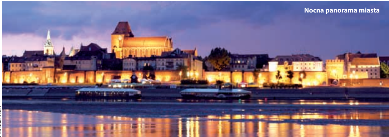
Nocna panorama miasta

Lato w Toruniu to również czas ciekawych wydarzeń sportowych i kulturalnych. Nie zabraknie ich również podczas długiego sierpniowego weekendu. Już w piątek 15 sierpnia wyjątkowych wrażeń dostar-