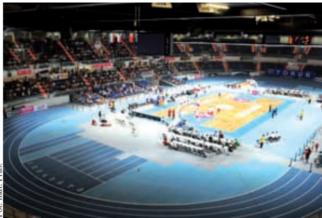
Impreza sportowa Basket Cup

Toruń to miasto niezwykle. Nie tylko ze względu na fakt, że to właśnie tu urodził się Mikołaj Kopernik. Wyjątkowy klimat gotyckiego grodu, smak znakomitych pierników oraz liczne atrakcje turystyczne sprawiają, że jest to jedno najchętniej odwiedzanych przez turystów miejsc w Polsce.