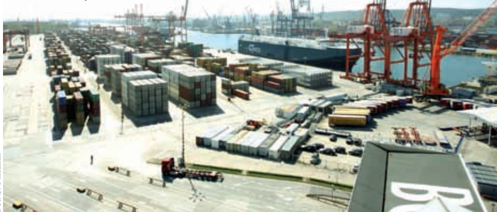
BCT - Bałtycki Terminal Kontenerowy

Przebudowa istniejącego intermodalnego terminalu kolejowego w rejonie Nabrzeża Helmskiego I polegać będzie na zwiększeniu długości użytko-