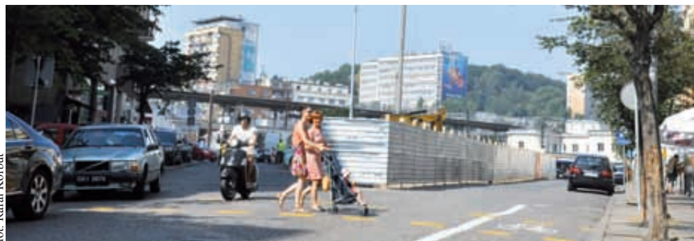
Starowiejska pomału przejmując rolę „salonu Śródmieścia”

pod względem obsługi ruchu tranzytowego ul. Starowiejska nie odgrywa znaczącej roli.