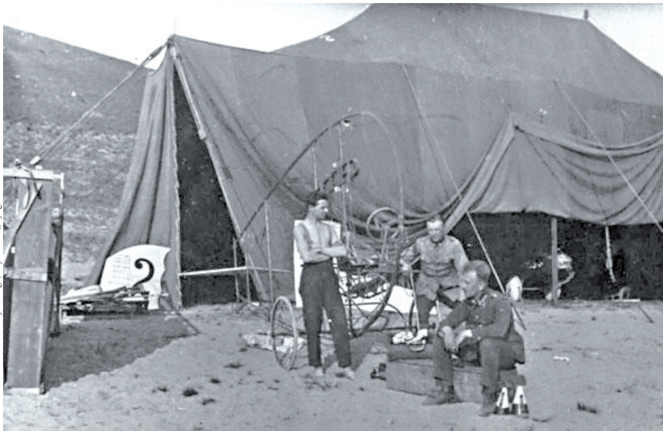
Szybowiec „Bydgoszczanka”

Była taka dyscyplina sportowa, która nie wymagała od organizatorów budowania wielkich stadionów wraz z trybunami. Nie były potrzebne zaplecza dla sportowców i zbiorniki paliwa.