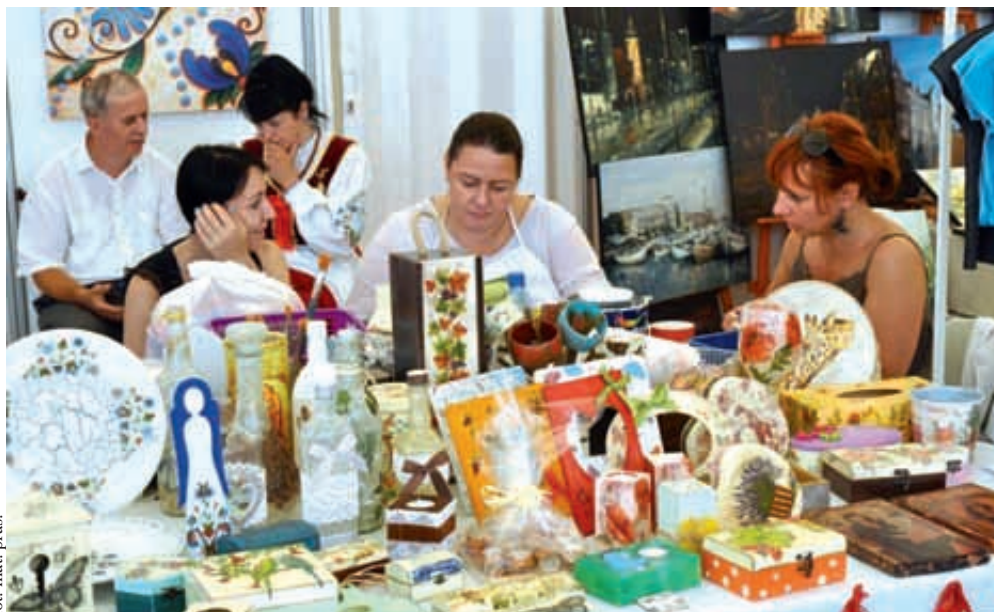
W programie m. in. warsztaty malowania na szkle, ceramiki, decoupage czy haftu

Pomorskie Smaki to wielkie święto tradycyjnej kuchni i bogactwa kultury naszego regionu.