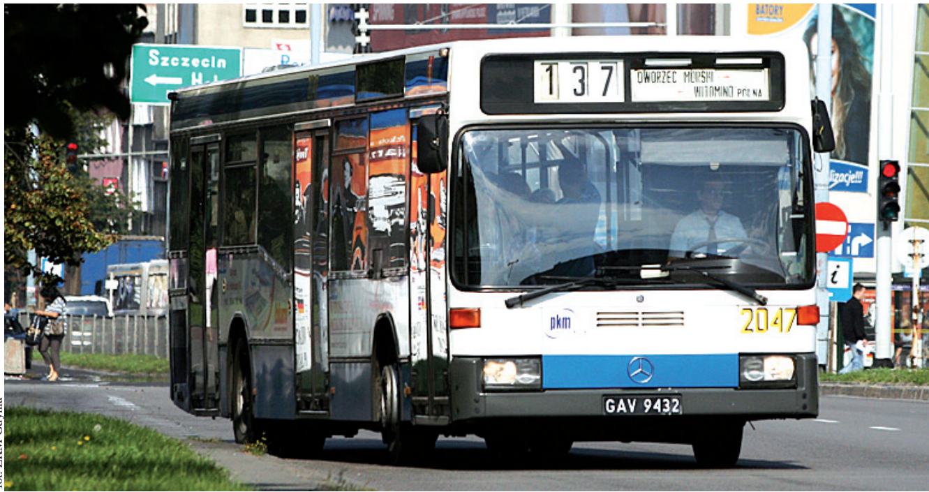
Przepisy stanowią, że bilet należy skasować niezwłocznie po wejściu do autobusu

dziecka niepełnosprawnego, jest znalezienie dla niego miejsca i bezpieczne usadowienie na krześle – zaznacza matka. - Starsza córka w tym czasie stanęła przy szybie i trzymając się uchwytu, czekała na znalezienie przez babcię miejsca obok siebie. Gdy babcia posadziła młodszą dziewczynkę i sama usiadła, odwróciła się do starszej, mówiąc: „Choć, skasujesz bilet?”. Dziecko usiadło