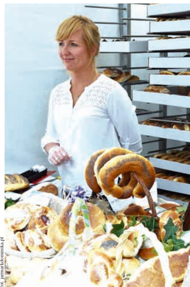
Na Święto Chleba przygotowano specjalną ofertę

swoje stoisko sprzedawca, jeśli tylko spróbują, wracają po kolejne produkty. W tym roku po raz pierwszy można spróbować innego hiszpańskiego przysmaku – churros, a przy okazji zobaczyć, jak się robi ten słodki specjał.