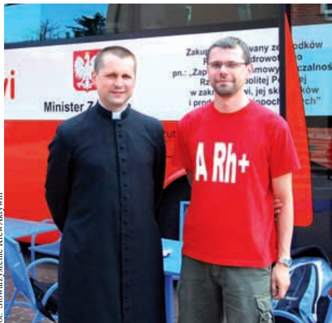
Zbiórka krwi przy karwińskiej parafii

Honorowym krwiodawcą może zostać każda zdrowa osoba w wieku 18-60 lat, ważąca powyżej 50 kg i legitymująca się dokumentem ze zdjęciem i numerem PESEL. Na oddanie krwi nie przychodzimy na czczo – należy zjeść śniadanie i można wypić kawę. Przed oddaniem krwi każdy jest dokładnie przebadany. Oddaje się 450 ml krwi pełnej. Cała procedura trwa około 30-45 minut (samo oddanie około 7 minut). Honorowemu krwiodawcy w