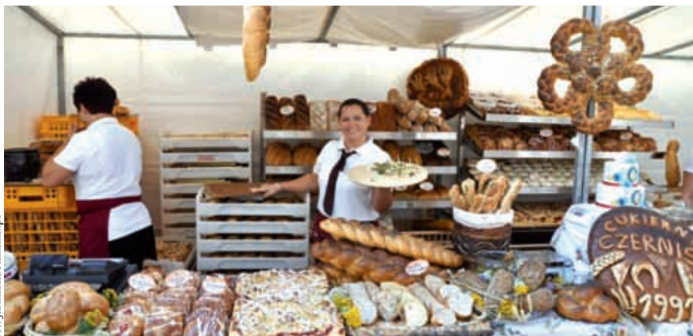
Regionalne smakołyki kuszą przechodniów

Chociaż dzień poświęcony był wyrobom piekarniczym, warto zwrócić uwagę na wielość i różnorodność stoisk z żywnością na Jarmarku świętego Dominika. Na ulicach Szerokiej i Grobli II stragany kuszą produktami spożywczymi z Polski i z zagranicy. Obok tradycyjnych wiejskich przysmaków, takich jak pajda ze smalcem, kaszubskie ruchanki czy góralskie oscypki, znajdują się stoiska z żywnością z dalekich stron takie, jak „Naturalne przysmaki kuchni bałkańskiej”. Kolorowy kramik oferuje produkty z Bułgarii i Macedonii, grillowane papryki, bakłażany i liście kiszzonej kapusty. Posmakować można bałkańskich sosów lutenica oraz ajvar. Stoisko ma już swoich stałych klientów, odwiedzających bałkańskie smaki corocznie. Nieco dalej, na ulicy Grobla II znajduje się inne stoisko oferujące produkty, będące rzadkością