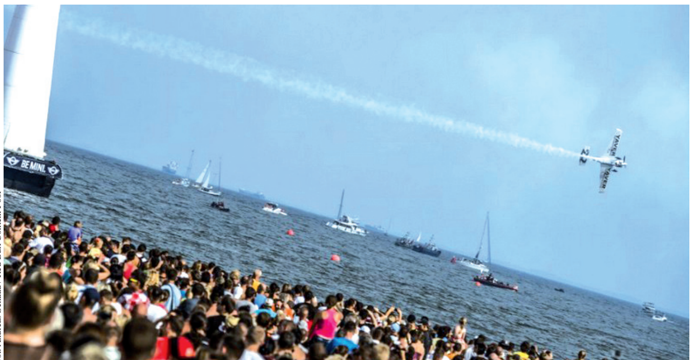
Popisy podczas Red Bull Air Race