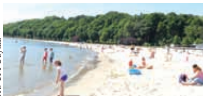
Nowa plaża jest szersza niż poprzednio

A co się stało z piaskiem wydobywanym z dna marin? Jak zauważyli plażowicze i osoby spacerujące bulwarem, codziennie