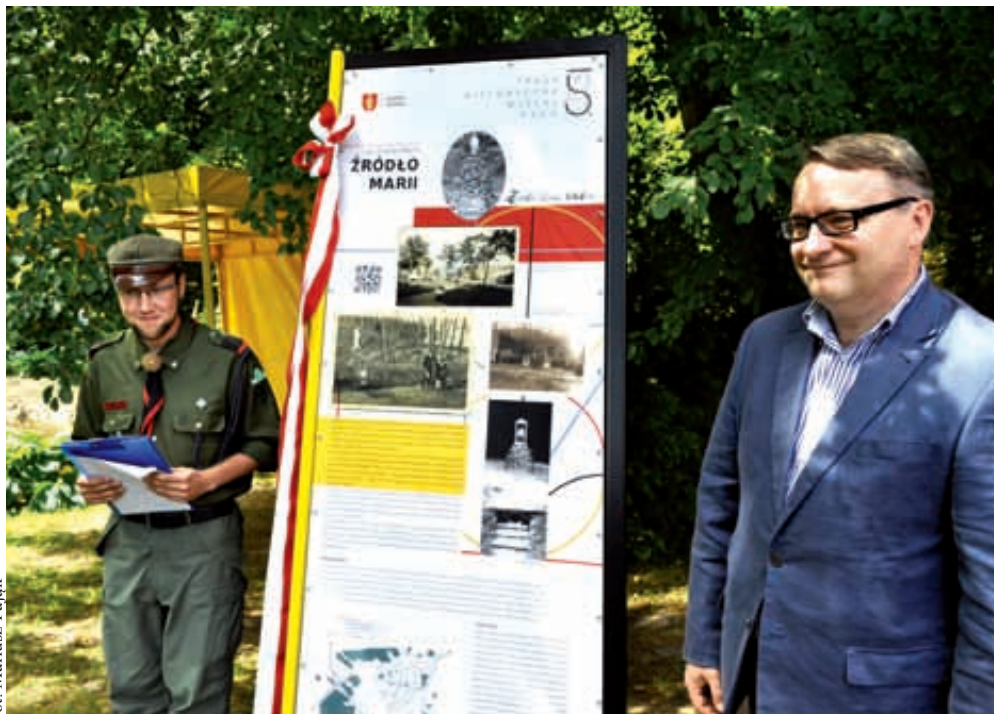
Marek Biernacki, minister sprawiedliwości, odsłonił jedną z tablic

Trwające ponad rok, intensywne prace Rady Dzielnicy Wielki Kack i Referatu Promocji i Turystyki Urzędu Miasta Gdyni oraz partnerów społecznych: Zrzeszenia Kaszubsko-Pomorskiego oddział Gdynia i Niezależnego Kręgu Instruktorów Harcerskich „Leśna Szkołka” zaowocowały powstaniem Trasy Historycznej Wielki Kack, która ma podkreślić bardzo istotny, choć mało znany rys dziejów naszego miasta. Gdynia jest miastem nowoczesnym i