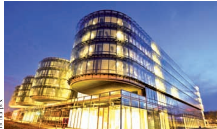
Pomorski Park Naukowo-Technologiczny został doceniony za nowoczesność

Konkurs Budowa Roku jest najbardziej prestiżowym wy-