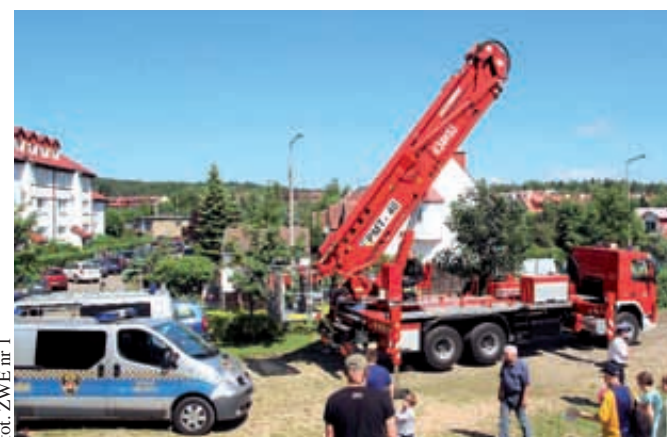
Rodzinny festyn to już tradycja