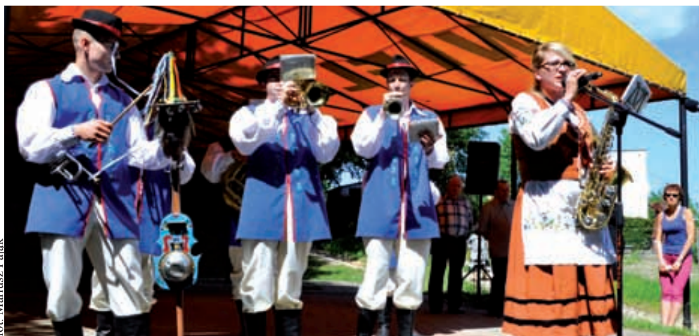
Kaszubska kapela umiliła otwarcie

dumnym ze swoich osiągnięć w ostatnich niemal dziewięciu dekadach, choć należy pamiętać o wielowiekowej historii tego miejsca.