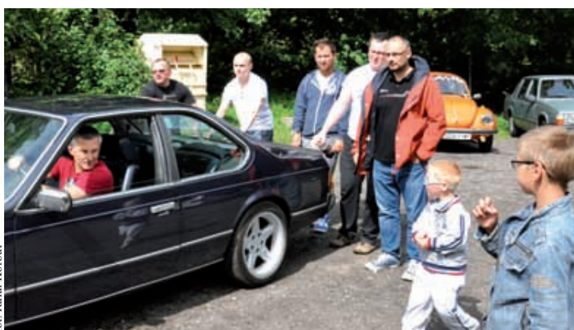
Pasjonaci motoryzacji podczas spotkania

W przejeździe brali udział pasjonaci motoryzacji, w tym także ci skupieni w Automobilklubie Morskim. Początek wydarzenia