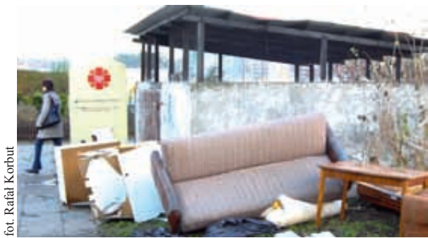
fol. Rafał Korbut