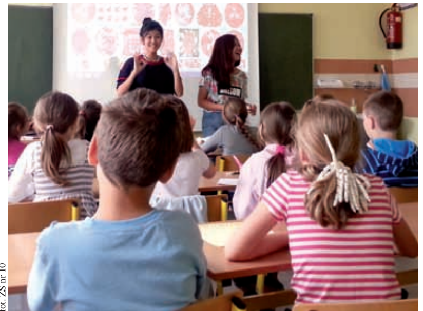
foi. ZS nr 10

Dzieciaki miały okazję poznania innych obyczajów