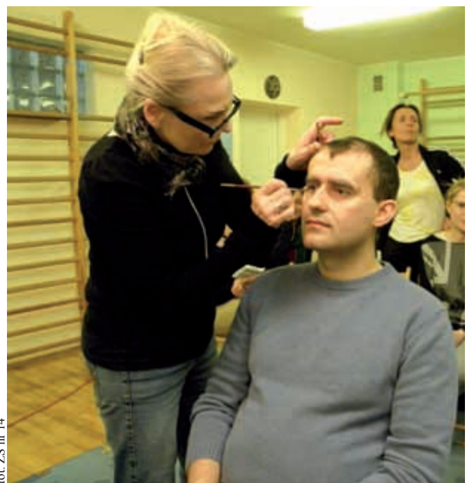
Uczestnicy przygotowują się do udziału w spektaklu