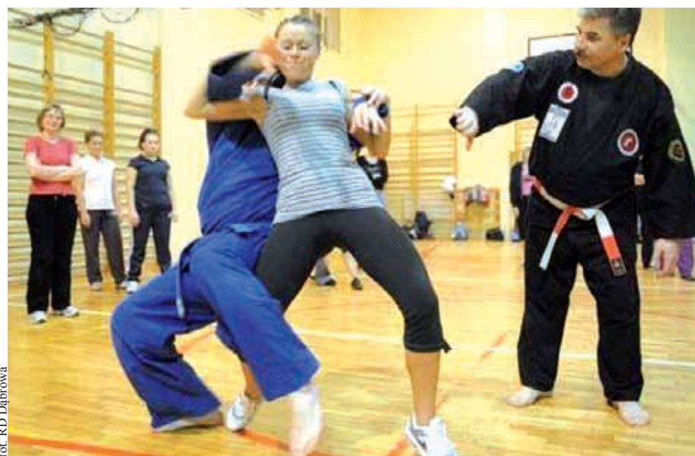
fol. RD Dąbrowa

- Samoobrona jest bardzo szczególną dziedziną wiedzy - wyjaśniają. - W 99 przypadkach na 100 może wydać się niepotrzebna i abstrakcyjna, w ostatnim przypadku zaś okaże się wiedzą priorytetową i konieczną do zachowania życia, zdrowia lub mienia - swojego i najbliższych. Myśl przytomnie, reaguj właściwie, bądź zawsze w gotowości!