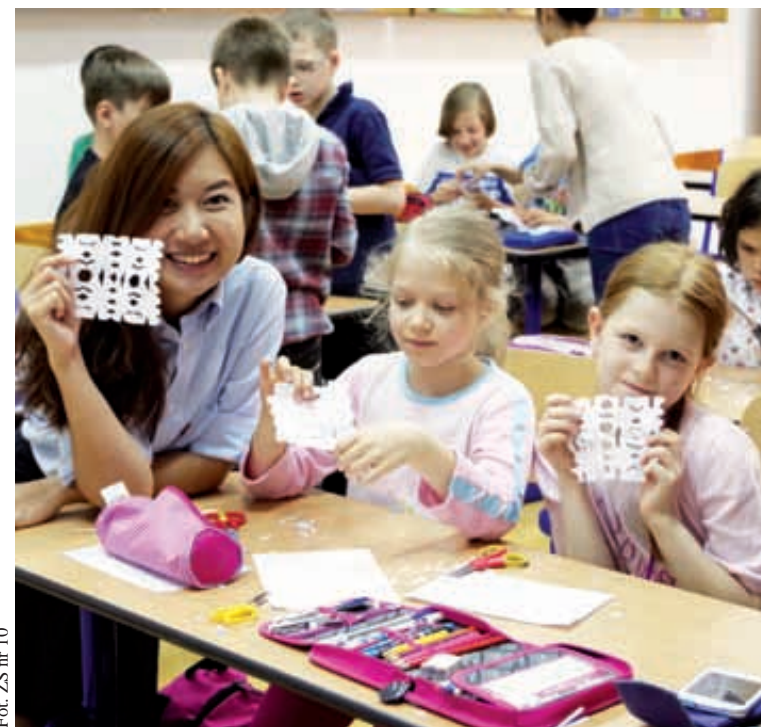
Fot. ZS nr 10

Zagraniczni goście i polscy uczniowie bardzo się polubili