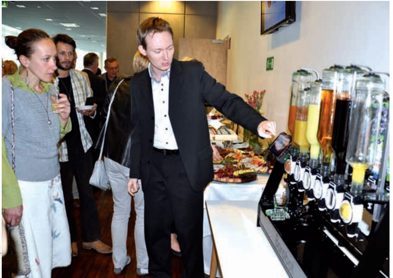
Prezentacja robota robiącego drinki

ganizatorem jest Gdynińskie Centrum Wspierania Przedsiębiorczości, sprowadza się do umożliwienia realizacji pomysłów biznesowych przez ludzi, którzy albo nie mają jakichkolwiek doświadczeń na tym polu,