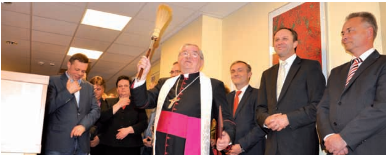
Otwarcie i poświęcenie nowego obiektu

Wszyscy zainteresowani mieszkańcy Pomorza mogli przekonać się jak wygląda wnętrze nowego budynku. Każdy z gości miał możliwość obejrzenia obiektu i jego wyposażenia, a także spotkania i rozmowy ze specjalistami