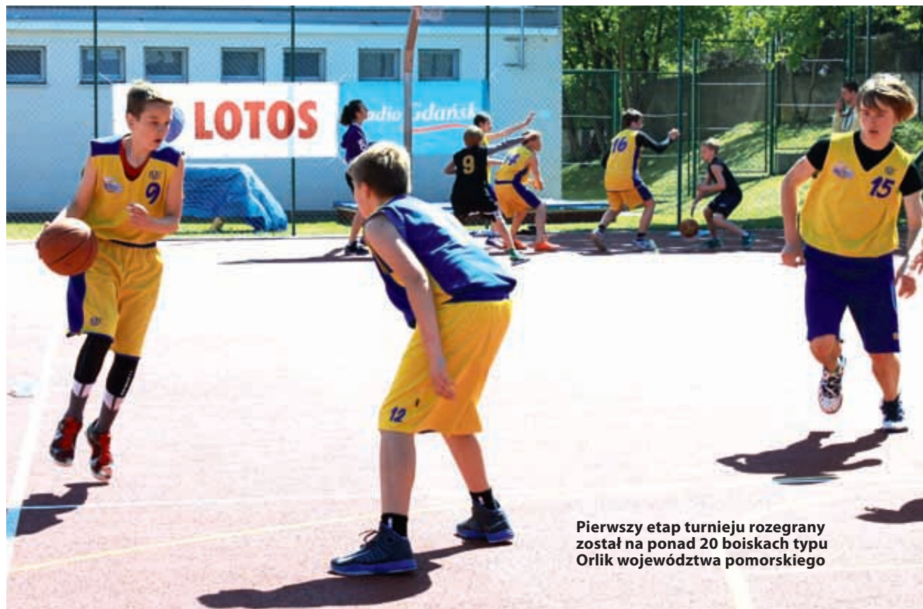
Pierwszy etap turnieju rozegrany został na ponad 20 boiskach typu Orlik województwa pomorskiego

Zarówno w rywalizacji Szkół Podstawowych, jak i Gimnazjów zobaczymy po dwa