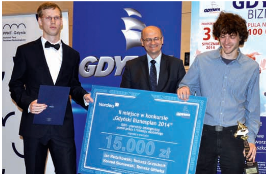
Zdobywcy drugiego miejsca

Właśnie wyłoniono zwycięzców dwunastej edycji konkursu dla przedsiębiorczych Gdyński Biznesplan 2014 . WIĘCEJ STR. 4