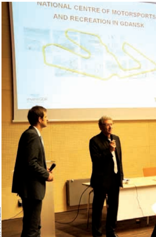
Debata na temat koncepcji budowy toru