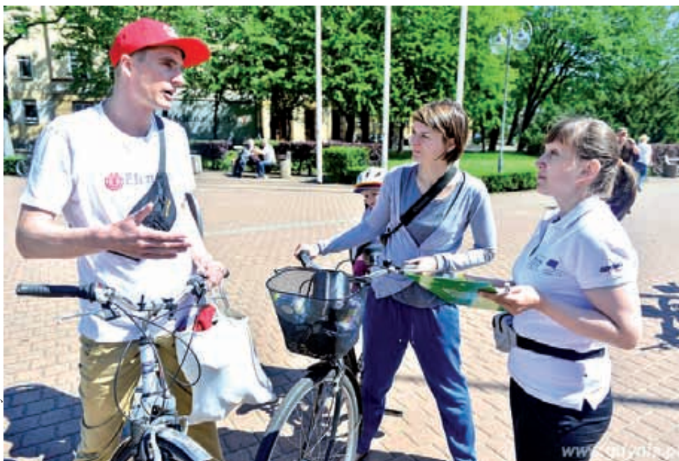
fol. UM Gdynia

Na uczestników pikniku czekało wiele atrakcji: zabawa z Profesorem Why, edukacyjna gra, symulatory lotów, trampolina, atrakcje dla najmłodszych od Centrum Nauki EXPERYMENT, foodtruck oraz rowerowa kawiarnia. Oprac. DK