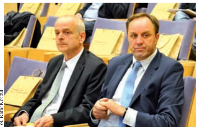
Mieczysław Struk (po prawej), marszałek województwa pomorskiego