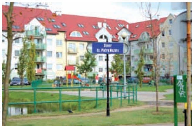
Skwer Ks. Mazura wzbogaci się o zewnętrzną siłownię

Na Karwinach wymiana podłogi w sali sportowej Zespołu Szkół nr 10 to koszt 99,7 tys. zł. Plac sportów miejskich dla Leszczynek (przy ul. Morskiej 116 za Lidlem) obejmie obiekt sportowo-rekreacyjny do gim-