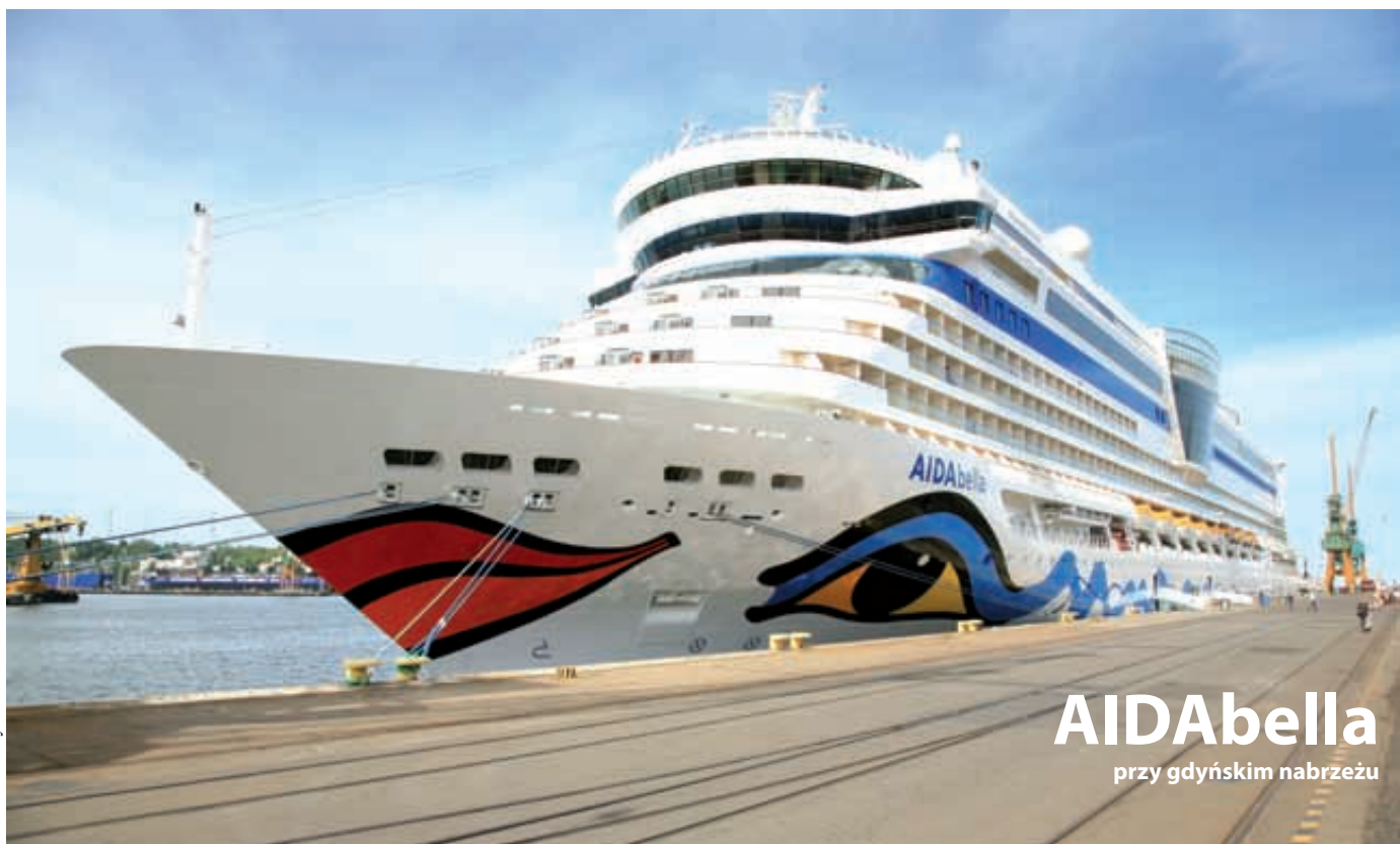
AIDAbella przy gdyńskim nabrzeżu

Po raz kolejny majestatyczne wycieczkowce wraz z pasażerami na pokładzie odwiedzają Gdynię. Sezon już się rozpoczął od wizyty pływającego pod japońską banderą statku Asuka II. A w drugiej połowie czerwca przy kei ustawi się prawdziwy gigant - liczący 317 metrów „Celebrity Eclipse”. Takiego kolosa w żadnym polskim porcie jeszcze nigdy nie było.