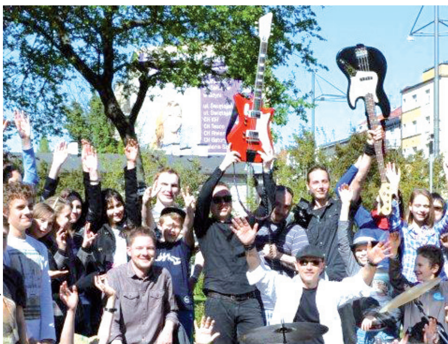
Dzieciaki zaśpiewały aż w 5 językach

10 lat mija od wstąpienia Polski do Unii Europejskiej. Mimo, że część uczniów Pierwszej Społecznej Szkoły Podstawowej im. Dzieci Zjednoczonej Europy w Gdyni nie pamięta 1 maja 2004 roku, ponieważ byli zbyt mali, to postanowili w oryginalny sposób uczcić dekadę naszego kraju w UE. Nagrali specjalny teledysk.