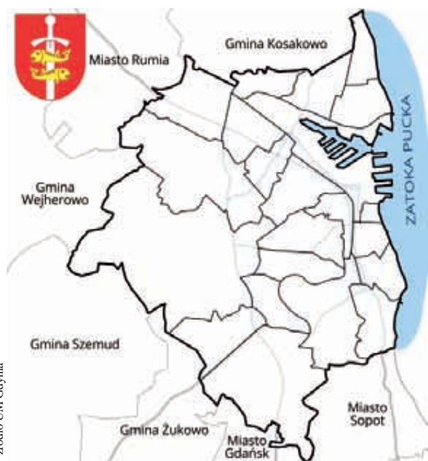
Podział na dzielnice Gdyni

Po raz kolejny problem wypłynął na terenie Dąbrowy, podczas formułowania postu-