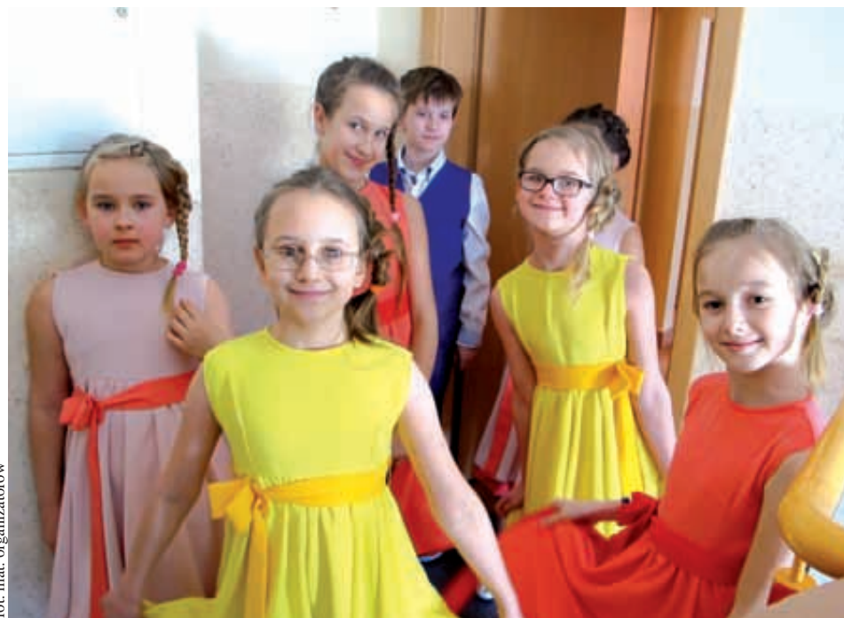
Młodzi gdyńscy artyści co roku odnoszą sukcesy podczas konińskiego festiwalu