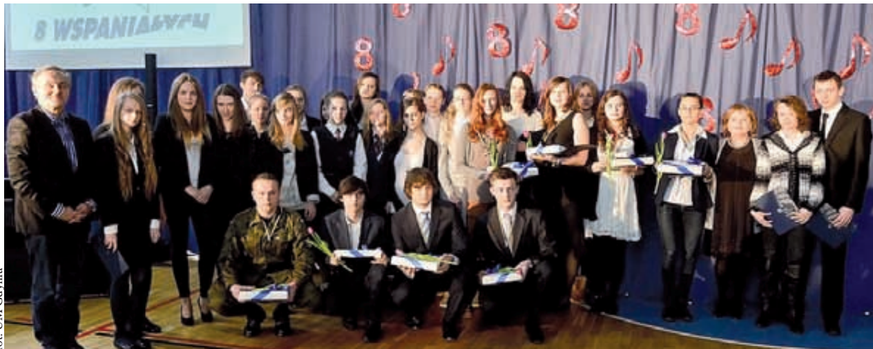
Za nami kolejny finał „8 wspaniałych”

Przypomnijmy, że konkurs jest kierowany do młodzieży gimnazjalnej i ponadgimnazjalnej. Jego celem jest promowanie pozytywnych zachowań, działań i postaw oraz upowszechnianie wolontariatu. Do konkursu zgłoszono uczniów gdyńskich szkół, którzy wyróżniają się pracą na rzecz potrzebujących: uczestniczą w wielu kampaniach społecznych, pracują jako wolontariusze np. w hospicjach i świetlicach socjoterapeutycznych, pomagają osobom niepełnosprawnym, znajdują czas, by swoim wsparciem służyć innym.