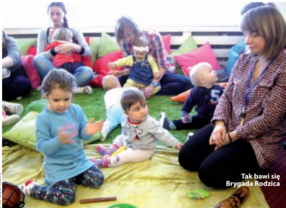
Tak bawi się Brygada Rodzica

Brygada Rodzica ma miejsce spotkań w filii nr 3 Biblioteki Publicznej w Gdyni, ul. Morska 113 (vis-a-vis Kauflandu), e-mail: brygadarodzica@gmail.com, FB - facebook.com/brygadarodzica. Siedziba Chylonek to Miejska Biblioteka Publiczna, filia nr 18, ul. Kartuska (e-mail: chylonki@gmail.com, FB - facebook.com/klubchylonki). „Pogórzanki - klub mamy i taty na krańcu Gdyni” jako miejsce spotkań mają Publiczną Bibliotekę, filię nr 4, ul. Porębskiego 21 (e-mail: pogorzanki@gmail.com, FB - facebook.com/Pomorzanki). Miejscem spotkań „Bujamy - klub mamy i taty” jest Miejska Biblioteka Publiczna filia nr 14 przy ul. Brzechwy 3/5 (e-mail: klubbujamy@gmail.com, FB - facebook.com/klubbujamy). Wszystkie informacje o działalności Klubów Rodzica można także znaleźć na stronie http://www.gdyniarodzinnia.pl.