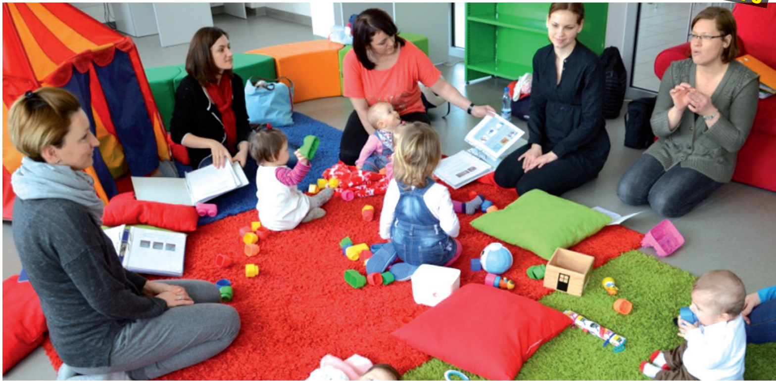
Dot. Spotkanie członkin klubów Pogórzanki