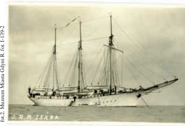
fol. 2. Muzeum Miasta Gdyni R. fot. 1-139-2

Polska Marynarka Wojenna pomimo młodego wieku posiadała bardzo liczne, partnerskie kontakty międzynarodowe. Wynikały one z racji pełnionej służby przez polskich oficerów i marynarzy na okrętach w czasach, gdy Polska była pod zaborami. Do Gdyni z wizytami kurtuazyjnymi przybywały okręty zaprzyjaźnionych państw, dzięki którym stwarzano