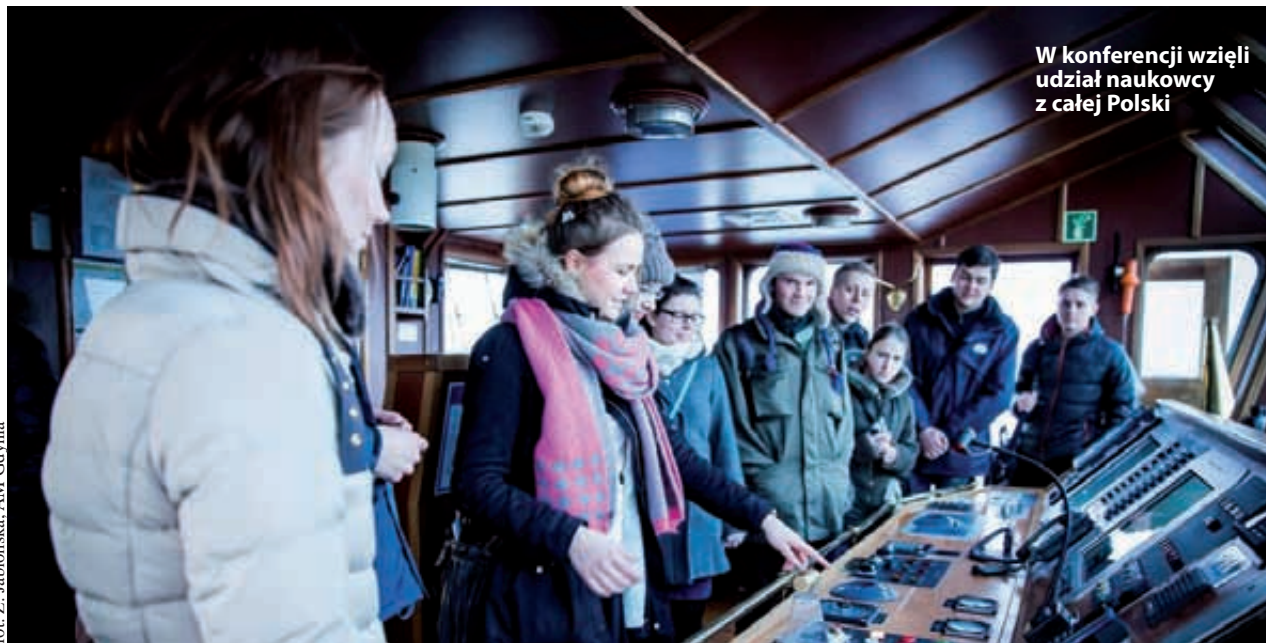
W konferencji wzięli udział naukowcy z całej Polski

Tematem przewodnim tegorocznej konferencji był „Wpływ innowacji na rozwój towaroznawstwa XXI”. W programie znalazły się prezentacje uczestników w następujących obszarach tematycznych: innowacje i ich wpływ na możliwości rozwoju współczesnego towaroznawstwa, innowacyjne technologie wykorzystywa-