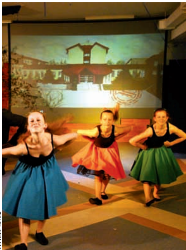
Na poziomie dzielnicowym odbywa się wiele ciekawych inicjatyw kulturalnych

- Dokonując oceny projektów komisja kierowała się m.in. atrakcyjnością zaproponowanego przedsięwzięcia, długofalowymi rezultatami przedsięwzięcia, w tym wpływem na integrację mieszkańców dzielnicy - wyliczając urzędniczy.