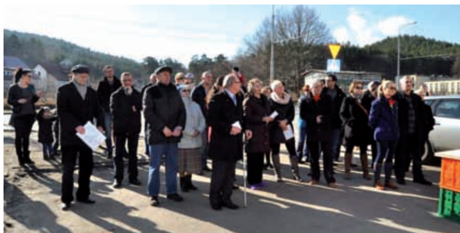
Mieszkańcy zapowiadają dalsze działania, w tym również dochodzenie swoich praw na drodze sądowej