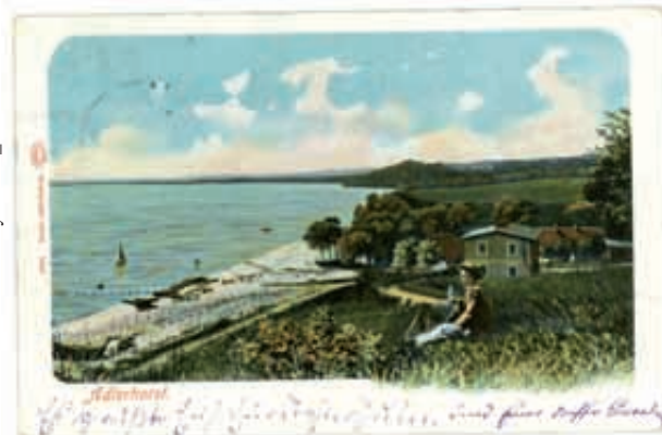
Fot. 1 Muzeum Miasta Gdyni 3507_3

wybudowaniem drogi łączącej Gdańsk z zachodnimi terenami Prus ułatwiła przemieszczanie się do Wejherowa, Pucka i dalej na zachód i północ. Droga prowadziła w kierunku dzisiejszego centrum Gdyni by na wysokości dworca SKM Gdynia Wzgórze Św. Maksymiliana rozwidlić się w dwóch kierunkach. W kierunku północnym (obecna ul. Świętojańska) biegła droga przez oksywieckie wzgórze obok kościoła św. Michała do Pucka oraz w kierunku zachodnim (obecna ul. Śląska i Morska) do Chyloni, Rumi i Wejherowa. Do Orłowa przybywało coraz więcej osób zainteresowanych wypoczynkiem letnim i zimowym. Walory morskiego powietrza zostały dostrzeżone o wiele wcześniej, gdyż w posiadłości położonej nad brzegiem morza bywała żona króla Polski: „Królowa Marysieńka (1641-1716) - Maria Kazimiera d'Arquien, z Francji do Polski przyjechała jako dwórka Ludwika Marii, żony Władysława IV, następnie Jana Kazimierza; poślubiła najpierw wojewodę kijowskiego Jana Zamoyskiego a owdowiawszy wyszła za hetmana Jana Sobieskiego i od