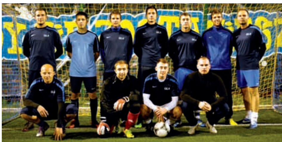
Skok stefczyka nadal nie zrezygnował z walki o czołowe miejsca. W czwartek gra ważny dla układu tabeli mecz

Otwartym pozostaje pytanie, kto do elity awansuje. Trzy drużyny do środowej