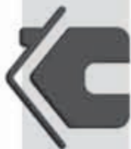
tabela ofert rynku pierwotnego