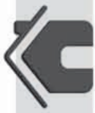
tabela ofert rynku pierwotnego