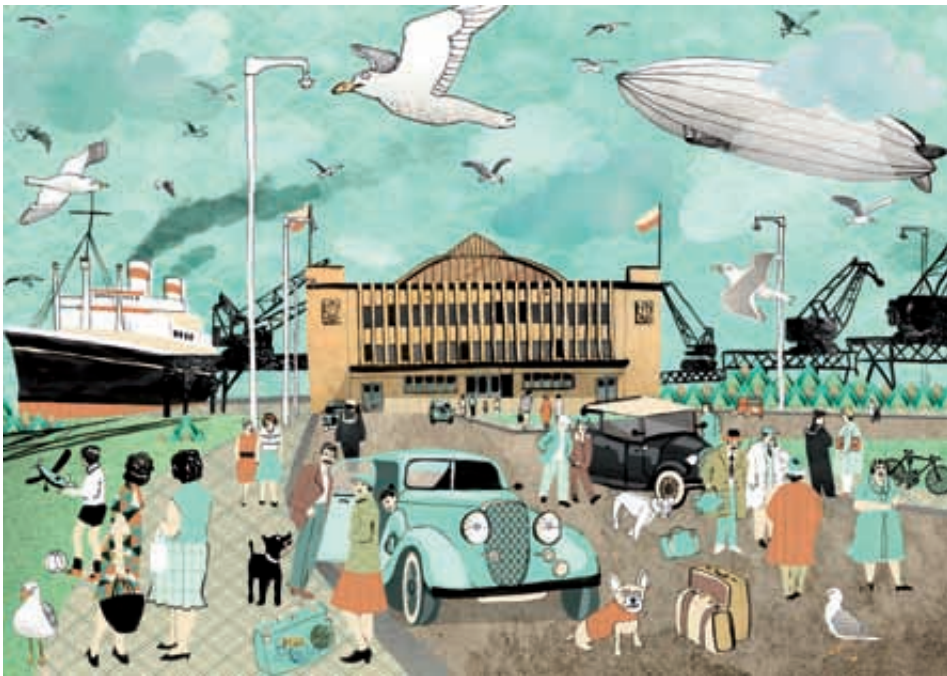
Muzeum Emigracji w Gdyni jest pierwszym projektem samorządowym na Pomorzu, realizowanym w ramach inicjatywy Jessica

Muzeum Emigracji to niezwykle przedsięwzięcie wyrastające na granicy edukacji, sztuki i rozrywki. W zabytkowym Dworcu Morskim, poddany przebudowie i gruntownemu remontowi, znajdzie swoje miejsce instytucja, która zajmie się wyjątkowym rozdziałem w polskiej historii. Inwestycja prowadzona jest w ramach unijnej Inicjatywy JESSICA. 14 września w godzinach od 13.00 do 18.45 w gdynskim InfoBoxie przy ul. Świętojańskiej 30 odbędą się warsztaty rodzinne oraz wykłady i pokazy dla wszystkich mieszkańców Trójmiasta. Kreatywne zajęcia wykorzystają zapal konstruktorów, aby przybliżyć najmłodszym budynek Dworca Morskiego i budowę statków pasażerskich oraz zachęcić do stworzenia kolorowej i fantazyjnej wizji przyszłej siedziby instytucji. Bajkowe puzzle z Dworcem Morskim, przygotowane specjalnie dla dzieci, w formie zabawy nawiązują do trwającej