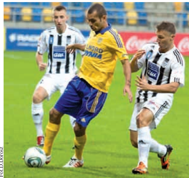
W Pucharze Polski czas na Koronę Kielce

Sandecja to niewygodny przeciwnik, który na boiskach I-ligowych jest już uznaną firmą. Wprawdzie tegoroczny sezon rozpoczął się dla tej drużyny słabo, ale na własnym boisku to zawsze groźny przeciwnik. O prze-