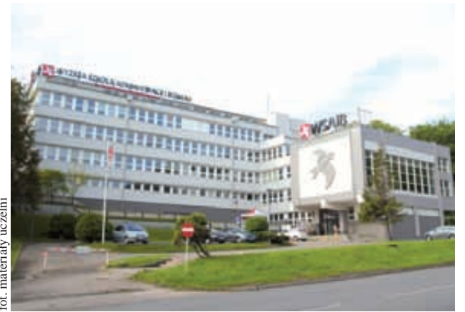
fol. materiały uczelni

W roku 2013/2014 na gdyńskiej uczelni będą studiowały osoby z 9 państw: Niemiec, Turcji, Słowacji, Hiszpanii, Rosji, Iranu, Ukrainy, Rumunii i Maroko. Oprac.(GB)