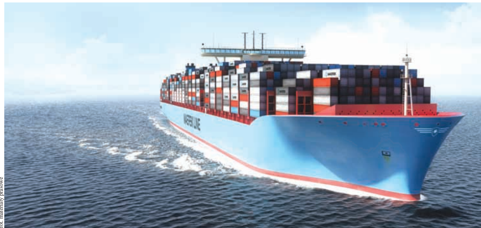
fol. materiały prasowe

Dokładnie 21 sierpnia do terminalu kontenerowego DCT Gdańsk SA wpłynie statek Maersk Mc - Kinney Moller. Aktualnie jest to największy na świecie kontenerowiec.