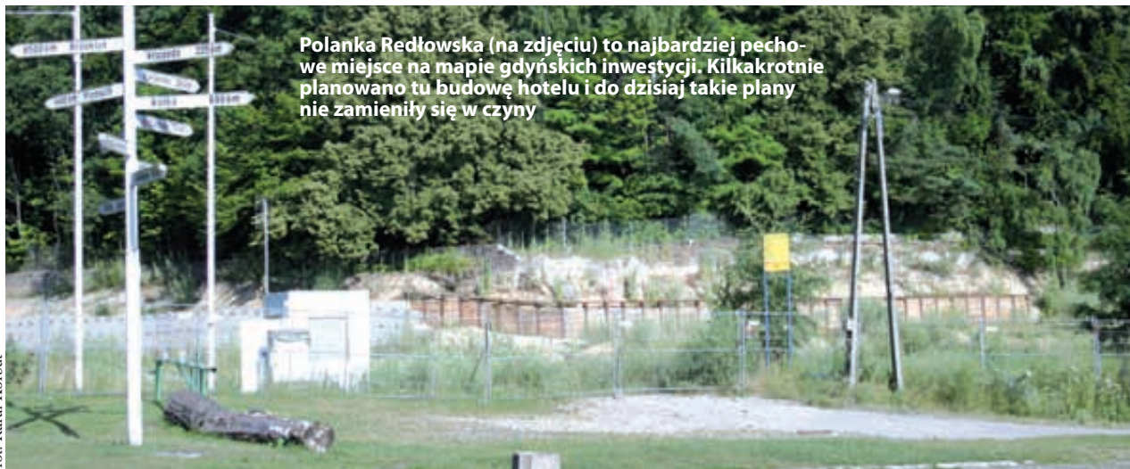
Polanka Redłowska (na zdjęciu) to najbardziej pechowe miejsce na mapie gdyńskich inwestycji. Kilkakrotnie planowano tu budowę hotelu i do dzisiaj takie plany nie zamieniły się w czyn

- Złożyliśmy do sądu wniosek o ogłoszenie upadłości spółki Projekt Gdynia. Na-