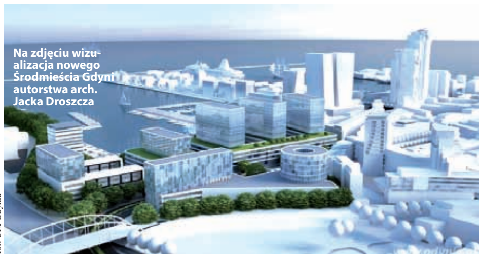
Na zdjęciu wizualizacja nowego Śródmieścia Gdyni autorstwa arch. Jacka Droszcza

List intencyjny w sprawie współpracy miasta i stoczni Nauta podpisano na początku lipca w gdyńskim InfoBoxie, a głównym założeniem tego dokumentu są wspólne działania nad skomunikowaniem nowego Śródmieścia z siecią gdyńskich ulic. Strony zadeklarowały wspólne finansowanie poszerzenia ulicy Węglowej, budowy ulicy Nowej Węglowej oraz rozbudowy ulicy Waszyngtona. Przypominamy, że wcześniej podobną deklarację złożył Polski Holding Nieruchomości, który dysponuje terenem Molo Rybackiego - tłumaczyła urzędniczy miejscy. Nowa część Śródmieścia ma powstać na terenie, któ-