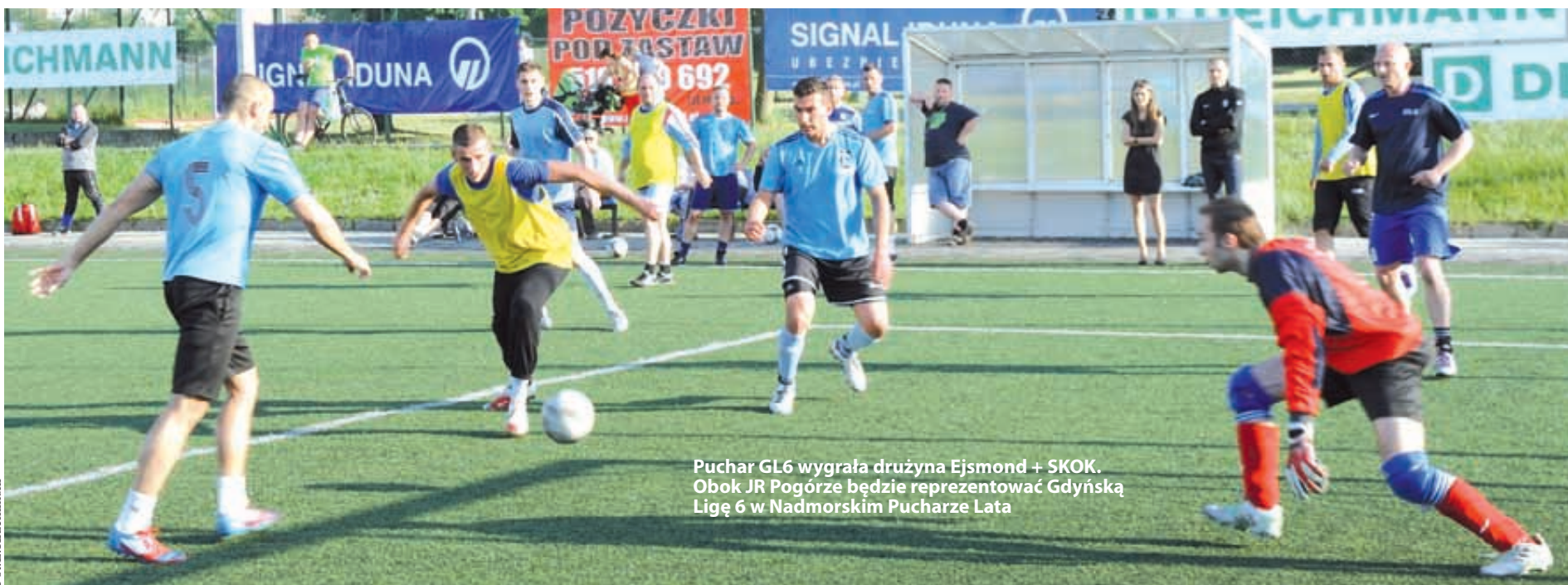
Puchar GL6 wygrała drużyna Ejsmond + SKOK. Obok JR Pogórze będzie reprezentować Gdynią Ligę 6 w Nadmorskim Pucharze Lata

PIŁKA NOŻNA | Sporo atrakcji czeka na piłkarskich kibiców w sobotę na gdyńskiej Checzy. Osiem zespołów powalczy o miano najlepszego zespołu sześciuosobowego na Pomorzu, a w przerwie turnieju będzie można zagrać w jednym zespole m.in. z Rafałem Murawskim.