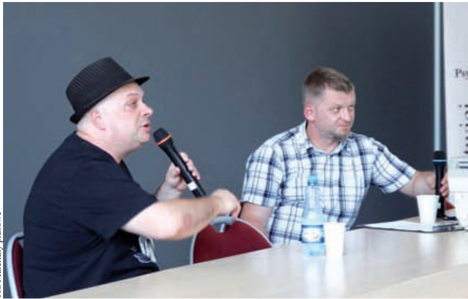
for. Materiały prasowe

Ponad 100 uczniów z trójmiejskich szkół pojawiło się na spotkaniu z muzykiem i dziennikarzem Krzysztofem Skibą w Wyższej Szkole Administracji i Biznesu w Gdyni. Spotkanie z muzykiem zorganizowane było przez stowarzyszenie In gremio i skierowano je do gimnazjalistów i licealistów. Tematem przewodnim wydarzenia była rola społeczeństwa obywatelskiego w kształtowaniu rzeczywistości politycznej i gospodarczej.