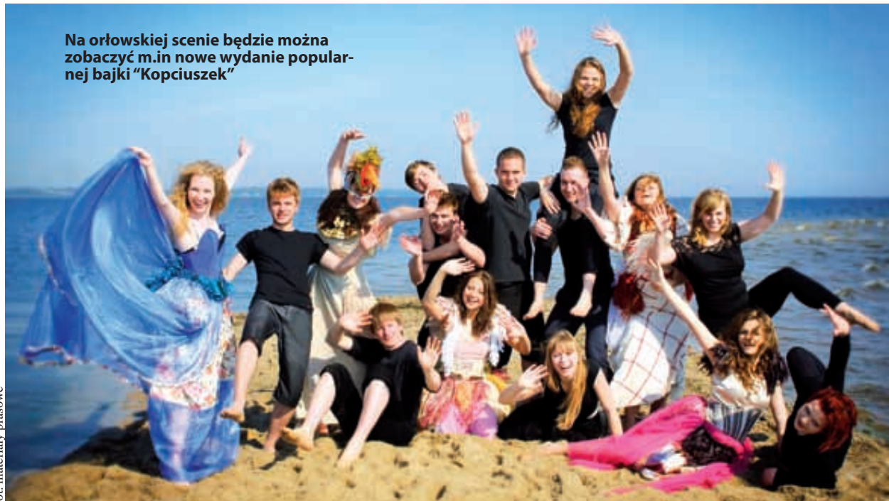
Na orłowskiej scenie będzie można zobaczyć m.in. nowe wydanie popularnej bajki "Kopciuszek"

Nietypowa i wypełniona nadmorskim piaskiem Scena Letnia w Orłowie zaprezentuje przez najbliższe trzy miesiące kilkanaście spektakłów teatralnych i koncertów.