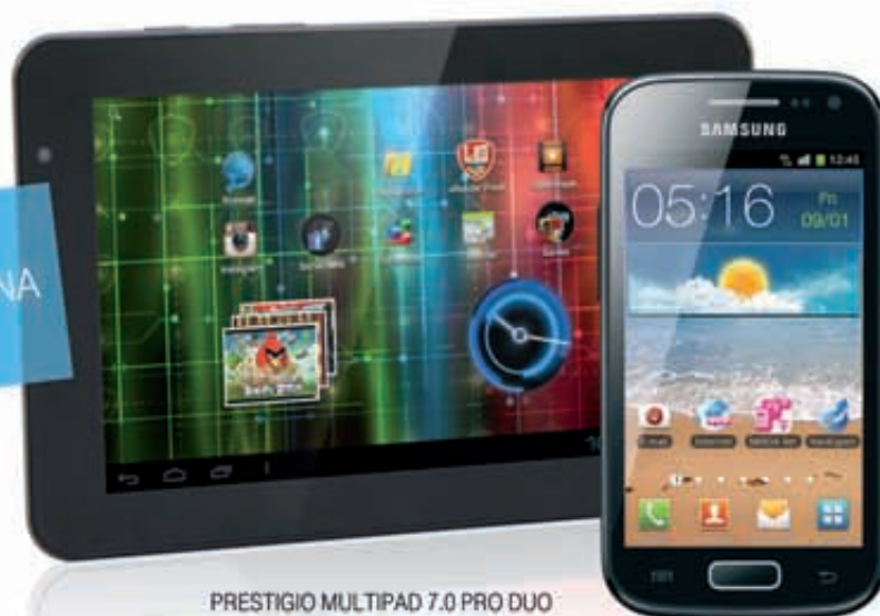
PRESTIGIO MULTIPAD 7.0 PRO DUO

ZESTAW ZA 1 ZŁ OPLATA MIESIĘCZNA 64,90 ZŁ