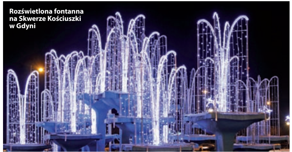
Rozświetlona fontanna na Skwerze Kościuszki w Gdyni

Półmetek etapu wojewódzkiego za nami. W czołówce miast, na które najchętniej głoszą internauci w regionie pomorskim jest m.in. Gdynia, Gdańsk i Wejherowo. Ale wszystko może się jeszcze zmienić, ponieważ wiele urzędów przesyła jeszcze zdjęcia iluminacji świątecznych oraz zachęca do