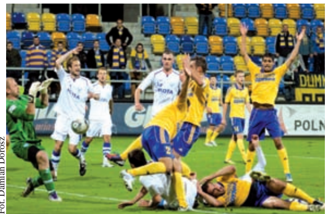
To nie był udany rok Arki Gdynia. Latem nie udało się wrócić do Ekstraklasy a jesienią żółto-niebiescy nie nawiązali walki z czołówką I Ligi

Juniorzy Arki Gdynia wywalczyli mistrzostwo Polski do lat 19! W finałowym turnieju rozegranym w Gdyni Arkowcy okazali się lepsi od Lecha Poznań, Pogoni Szczecin i Zagłębie Lubin. Natomiast do swojego premierowego sezonu w II lidze przy-