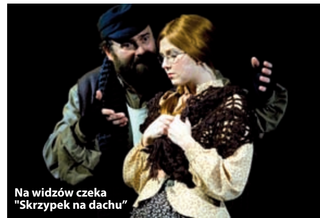
Na widzów czeka „Skrzypek na dachu”

Koncerty Sylwestrowe odbędą się także w dniach 1 i 6 stycznia o godz. 17 oraz w dniach od 2 do 5 stycznia o godz. 19.