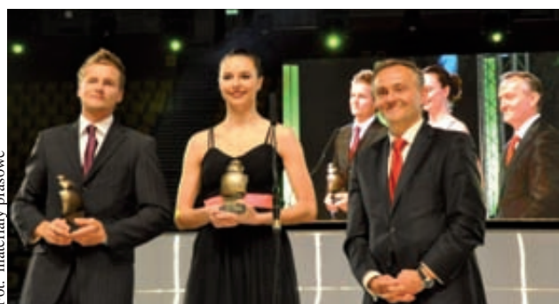
Mitrosz i Czajkowski najlepsi w Gdyni w 2011 roku

Siatkarkom Atomu Trefla Sopot dopiero po piątym meczu udało się awansować do finału PlusLigi Kobiet. W nim zmierzyły się z ekipą Bank BPS wacy MEYN SOLEX Lębork a koszykarki Lotosu Gdynia nie obroniły Pucharu Polski.