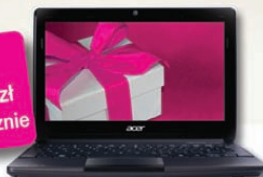
Netbook Acer Aspire ONE D270

Chciałbyś mieć nowy komputer na święta? Spraw sobie prezent i wybierz poręcznego netbooka Acer Aspire. Dodatkowo w prezencie od T-Mobile otrzymasz usługę blueconnect noc, dzięki której będziesz mógł korzystać z Internetu w nocy bez limitu za darmo.