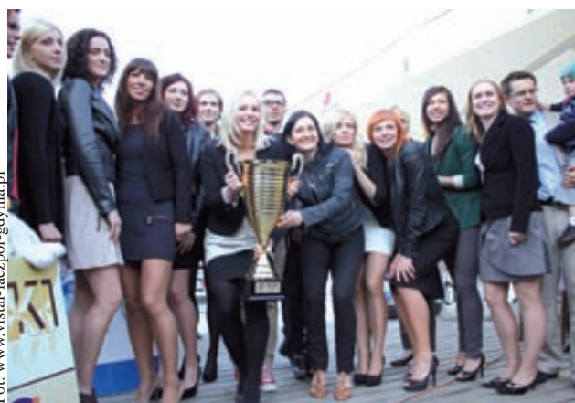
Mistrzynie Polski szczypiornistki Vistal Łączpol Gdynia prezentują okazały puchar