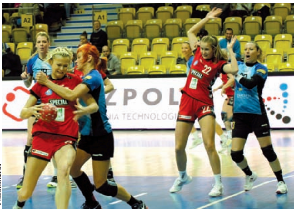
Tabela PGNiG Superligi

Przypomnijmy jeszcze, że w minionym tygodniu gdynianki grały w kratkę. Najpierw przegrały prestiżowe spotkanie z Zagłębiem Lubin