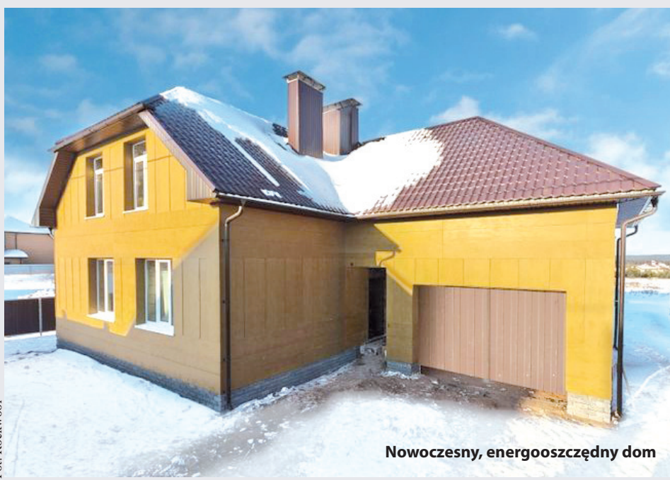
Nowoczesny, energooszczędny dom

kową do celów ogrzewania i wentylacji (EUco), obliczanego zgodnie z normą europejską, a także od spełnienia pozostałych warunków określonych w wytycznych NFOŚiGW (dotyczących m.in. minimalnej izolacyjności przegród, sprawności odzysku ciepła z wentylacji, instalacji grzewczej i przygotowania wody użytkowej). Dzięki dopłatom będzie można w dużej części pokryć wyższe nakłady związane z inwestycją w technologie energooszczędne, a także sfinansować weryfikację projektu budowlanego, próbę szczelności i potwierdzenia osiągnięcia standardu energetycznego. Program przewidziany jest na lata 2013-2018: budżet w wysokości 300 milionów złotych powinien pozwolić na realizację około 12 tysięcy domów jednorodzinnych i mieszkań w budynkach wielorodzinnych. Szczegółowe wymagania będą publikowane