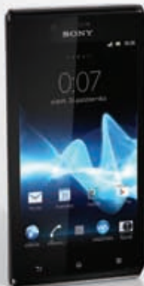
Sony Xperia™ J