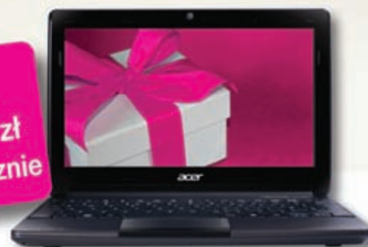
Netbook Acer Aspire ONE D270

Chciałbyś mieć nowy komputer na święta? Spraw sobie prezent i wybierz poręcznego netbooka Acer Aspire. Dodatkowo w prezencie od T-Mobile otrzymasz usługę blueconnect noc, dzięki której będziesz mógł korzystać z Internetu w nocy bez limitu za darmo.