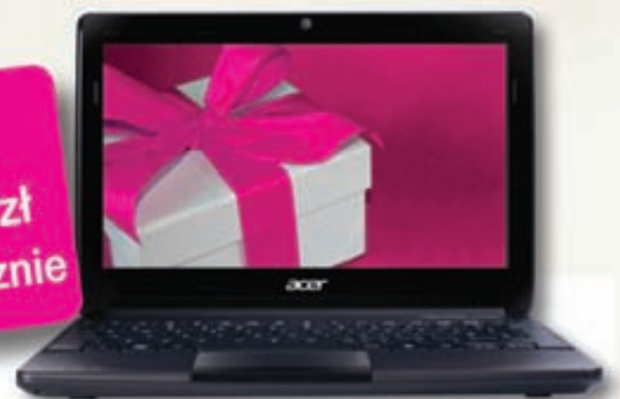
Netbook Acer Aspire ONE D270