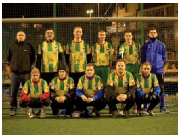
Babilon United nadal liczy się w walce o awans do I ligi