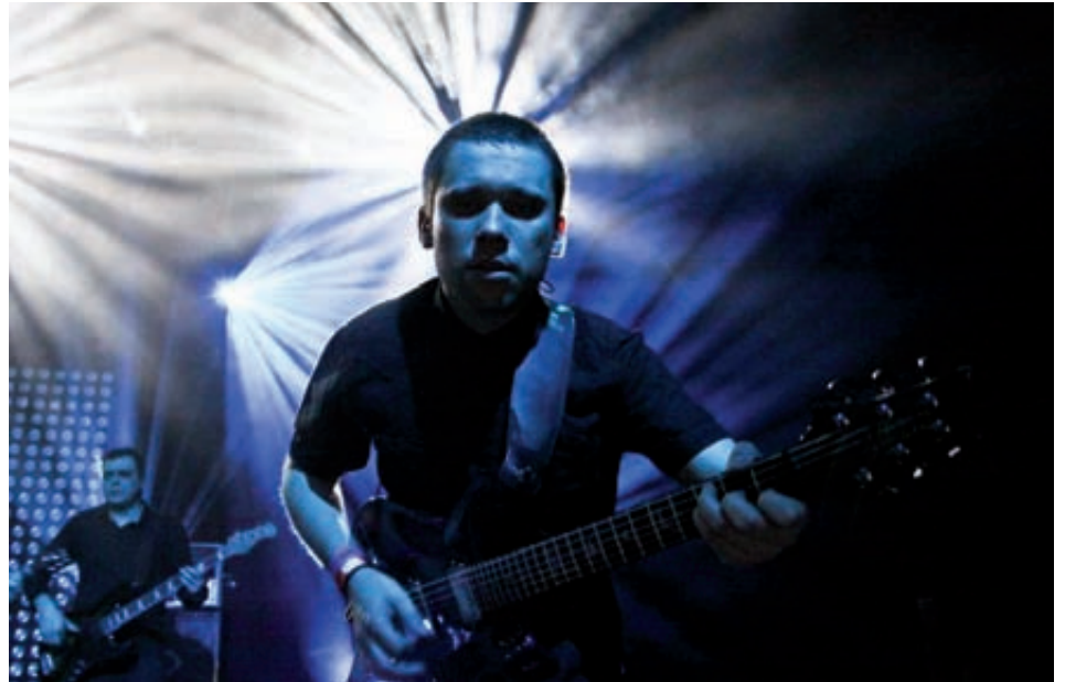
Początek koncertu w klubie Pokład przy Al. Jana Pawła II na Skwerze Kościuszki w Gdyni o godz. 20.

Dodatkowo będzie to unikalna szansa by usłyszeć rzadko wykonywane przez zespół utwory, których nie było na koncertach od lat! (stan)