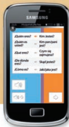
Samsung Galaxy mini 2