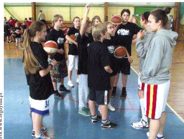
Poprzedni minicamp z udziałem gdynińskich koszykarek odbył się w Pucku

Minicamp odbędzie się w Hali Bursy Szkolnej w Człuchowie przy ul. Koszalińskiej 2. Początek zaplanowano na godzinę 11:00. (luK)