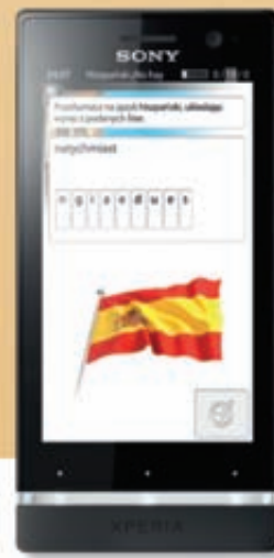
Sony Xperia™ U

Wybierz ofertę z telefonami od 1 zł w T-Mobile, a kurs językowy SuperMemo dostaniesz za darmo.