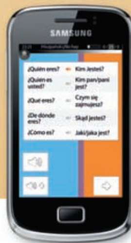
Samsung Galaxy mini 2