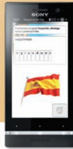
Sony Xperia™ U

Wybierz ofertę z telefonami od 1 zł w T-Mobile, a kurs językowy SuperMemo dostaniesz za darmo.