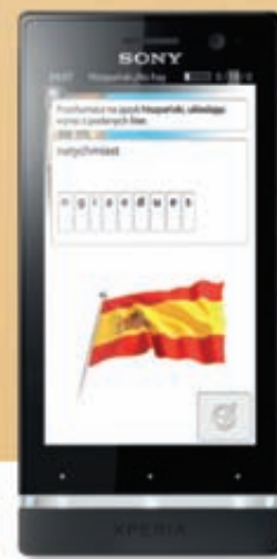
Sony Xperia™ U

Wybierz ofertę z telefonami od 1 zł w T-Mobile, a kurs językowy SuperMemo dostaniesz za darmo.