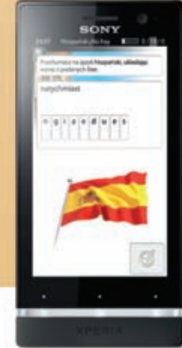
Sony Xperia™ U

Wybierz ofertę z telefonami od 1 zł w T-Mobile, a kurs językowy SuperMemo dostaniesz za darmo.