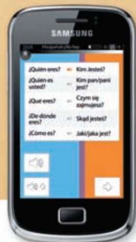
Samsung Galaxy mini 2