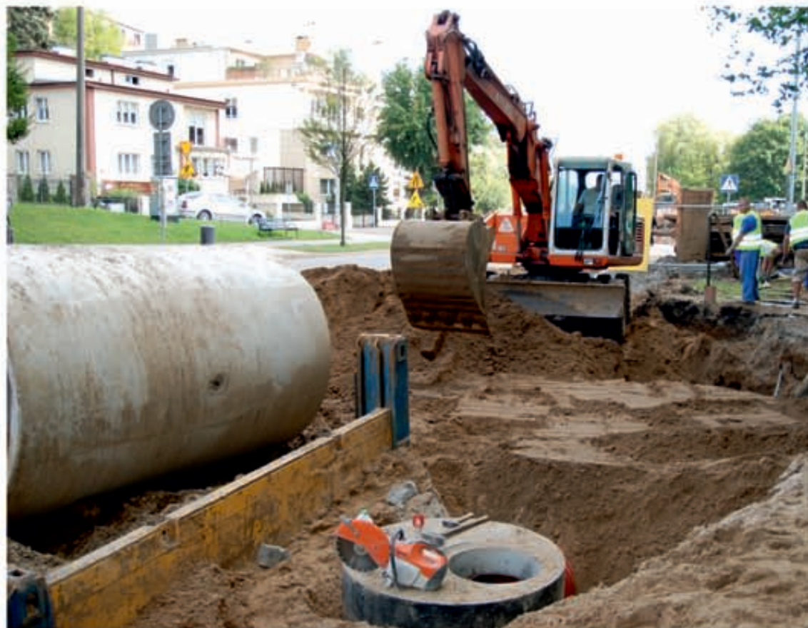
Prace w alei Marszałka Piłsudskiego potrwają do listopada br.

taką część sumy pokryje unijne dofinansowanie projektu z Funduszu Spójności w ramach Programu Infrastruktura i Środowisko. To w sumie 15,120 mln zł. Pozostała część - 6,653 mln zł pochodzić będzie z budżetu Gminy Miasta Gdynia. Miasto zapłaci też za budowę nowej oczyszczalni ścieków, która kosztować ma ok. 2,2 mln zł