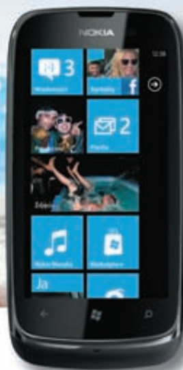
Nokia Lumia 610