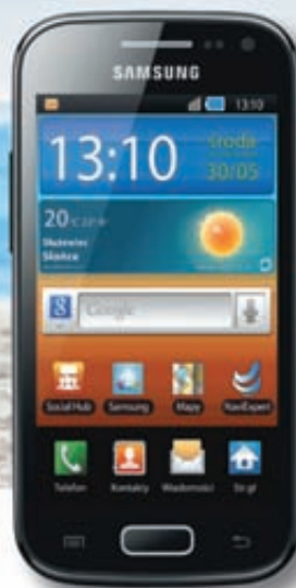
Samsung Galaxy Ace 2