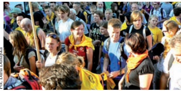
Pieszka Pielgrzymka Kaszubska

przygotowano X pielgrzymkę rowerową z Gdańska na Jasną Górę, która odbędzie się w dniach 21-27 lipca. Na trasie znajdują się miejscowości Osie, Brzoza, Ślesin, Turek i Wieluń. Koszt udziału to 360 zł. Opłata obejmuje wyżywienie, noclegi, ubezpieczenie, przewóz bagaży i powrót autokarem z Jasnej Góry do Gdańska. Zapisy odbywają się na formularzu na stronie internetowej www.roverowa.com.pl . (DD)