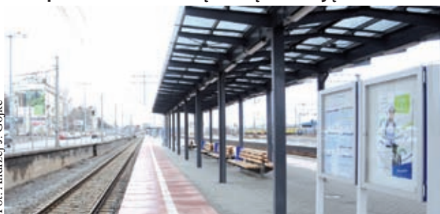
Na peronach brak wyświetlaczy z informacją o odjazdach