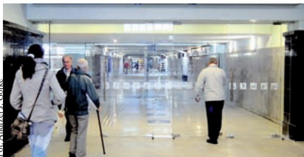
Duże przeszklone drzwi ciężko się otwierają

Tu też pojawił się problem: chodzi o przeszklone drzwi,