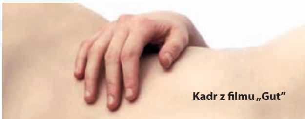
Kadr z filmu „Gut”

W sekcji konkursowej o nagrodę Prezydenta Miasta