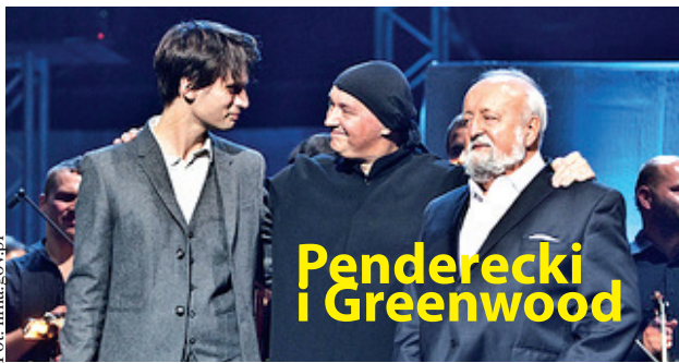
Penderecki i Greenwood