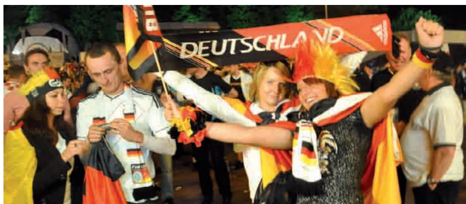
Niemieccy kibice mieli powody do zadowolenia...

Od rozpoczęcia turnieju z punktów Informacji Turystycznej w Gdańsku skorzystało już 25 tysięcy osób (to dwukrotnie więcej, niż odwiedziło punkty