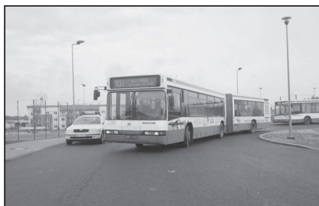
Pętla w Chwarznie Sokółce oznacza poprawę komunikacji dla mieszkańców tej nowej dzielnicy.

Dwie nowe pętle autobusowe, w Chwarznie – Sokółce i przy SKM w Redłowie oddano oficjalnie do użytku 26 stycznia w Gdyni. Rozwiąże to w bardzo dużym stopniu problemy komunikacyjne mieszkańców dzielnic, w których powstały. Uruchomiona została nowa linia – 221. Zmieniły się też rozkłady jazdy innych autobusów obsługujących linie gdzie powstały nowe pętle.