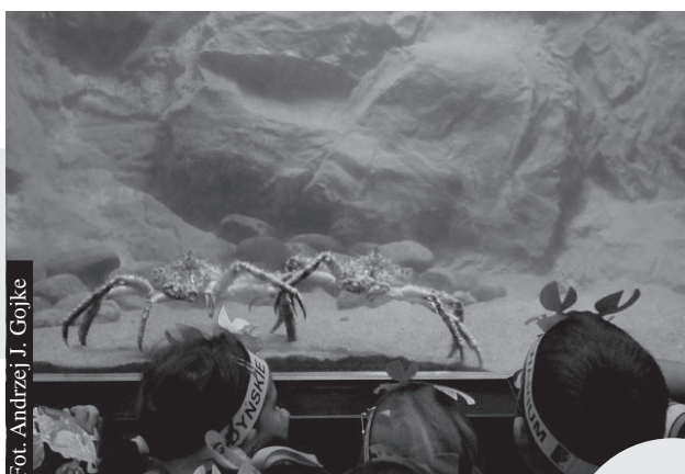
Podczas ferii w Gdynskim Akwarium czekać będzie na zwiedzających wiele atrakcji.