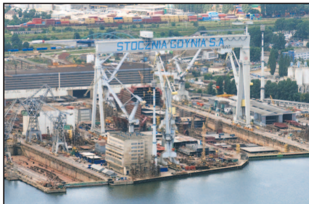
Majątek Stoczni Gdynia trafi niebawem pod młotek na otwartych przetargach.

Pierwszy termin na składanie przez stoczniowców ze Stoczni Gdynia S.A. wniosków o dobrowolne zwolnienie z pracy upłynął przed tygodniem. Do tego czasu chęć skorzystania warunków ujętych w uchwalonej przez sejm specustawie zgłosiło 5 tys. pracowników zakładu. W zamian, za odejście każdy otrzyma od 60 do 20 tys. w zależności od stażu pracy i wysokości zarobków.