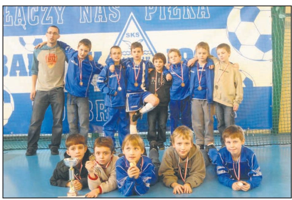
Młodzi piłkarze Bałtyku Gdynia nie mogą doczekać się nowego sezonu.