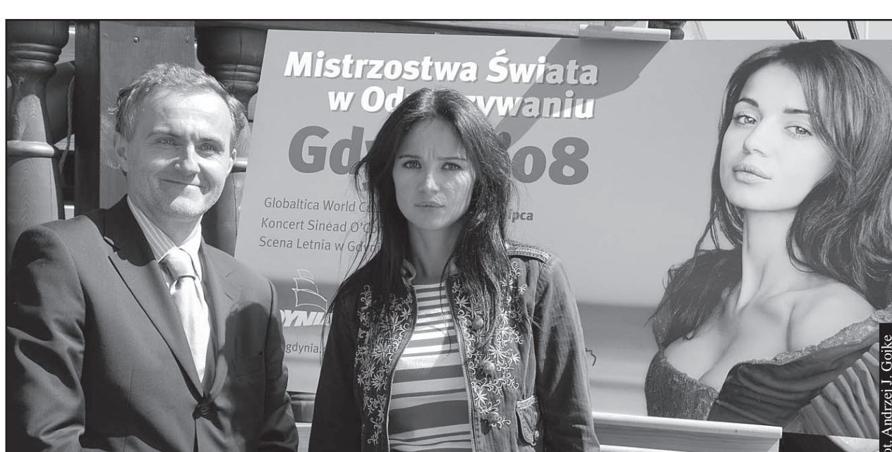
Twarzą kampanii reklamowej Mistrzostwa Świata w Odpoczywaniu była aktorka Anna Przybylska.

Urząd Miasta Gdyni został także wyróżniony przez branżowy magazyn BRIEF, za działania marketingowe, a konkretnie z kampanię Mistrzostwa Świata w Odpoczywaniu z gwiazdą