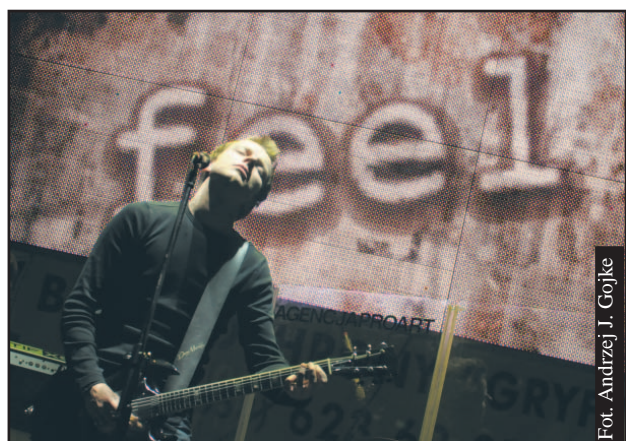
Fot. Andrzej J. Gójke