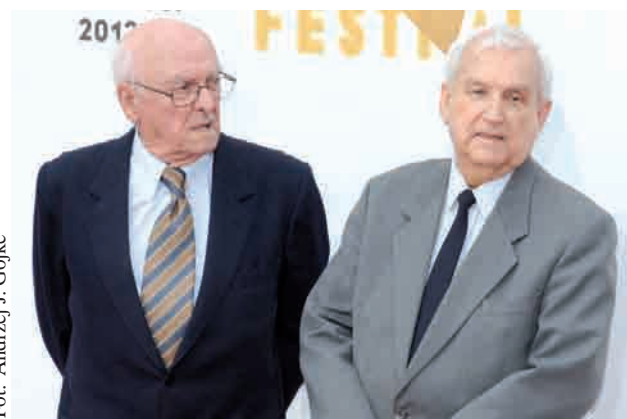
Laureatami Platynowych Lwów zostali dwaj operatorzy Jerzy Wójcik i Piotr Sobociński