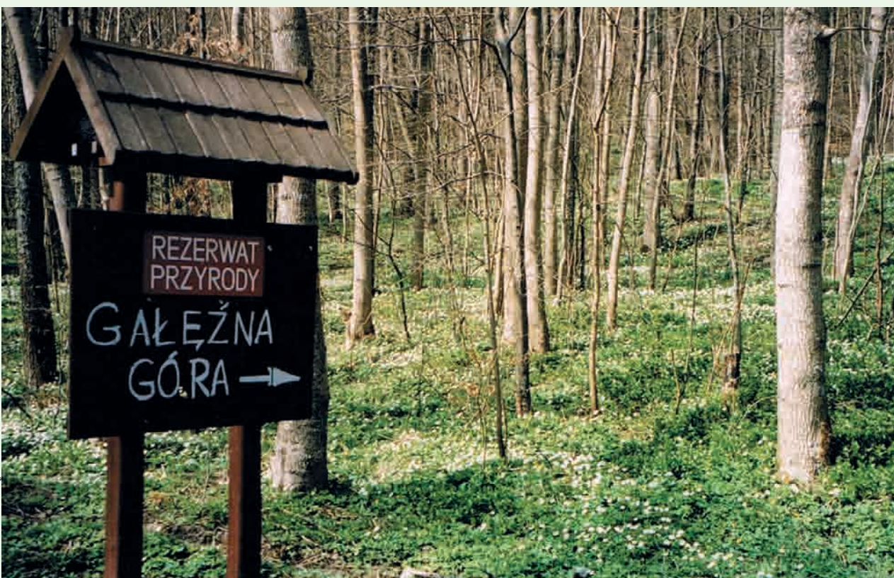
Rezerwat Gałęzna Góra z chronionymi gatunkami roślin, zwierząt i grzybów oraz wczesnośredniowiecznym grodziskiem i cmentarzyskiem kurhanowym

PRZYRODA | Na wniosek Lasów Państwowych powstały dwa nowe użytki ekologiczne w Leśnictwie Orle, Kamień i Stara Piła. Regionalna Dyrekcja Ochrony Środowiska w Gdańsku zleciła projekt planu ochrony rezerwatu przyrody Gałęzna Góra.