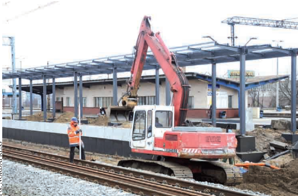
Modernizacja w obrębie dworca kolejowego Gdynia Główna

Planowany całkowity koszt realizacji projektu wynosi blisko 1.167 mln zł. Natomiast całkowity czas reali-