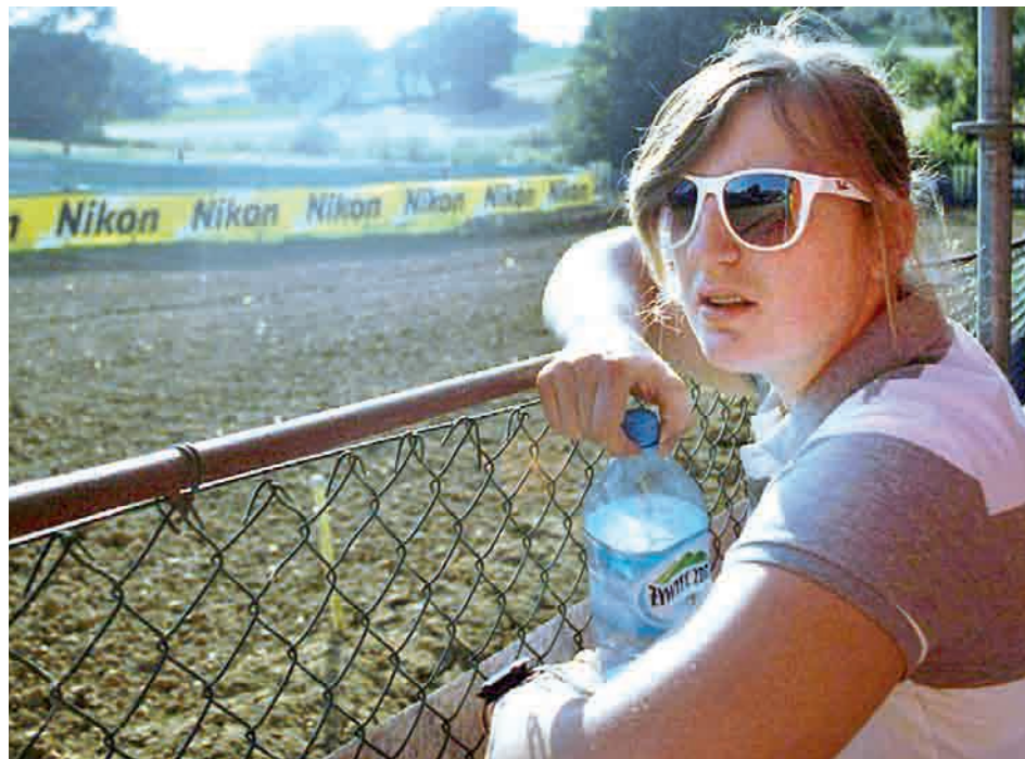
- Tu trzeba mieć upór, wytrwałość i przede wszystkim trzeba to lubić...