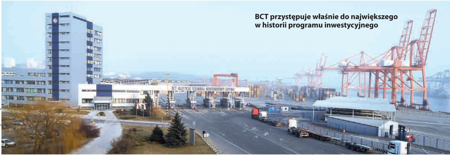
BCT przystępuje właśnie do największego w historii programu inwestycyjnego

GOSPODARKA | Kolejny rekordowy wynik osiągnięty w marcu przez bałtycki Terminal Kontenerowy w Gdyni pokazuje, że kryzys jak na razie nie dotyka terminali.