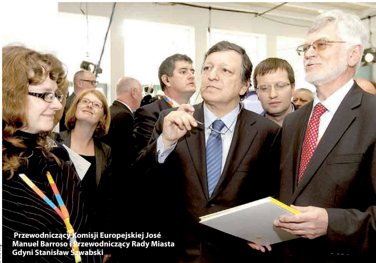
Przewodniczący Komisji Europejskiej José Manuel Barroso i Przewodniczący Rady Miasta Gdyni Stanisław Szwabski

Uczestnicy Europejskiego Szczytu Regionów i Miast dyskutowali nad takimi możliwościami i kierunkami zrównoważonego rozwoju miast, które uwzględniałby zarówno dbałość o przestrzeń miejską jak i potrzeby mieszkańców pobudzając ich jednocześnie do kreatyw-