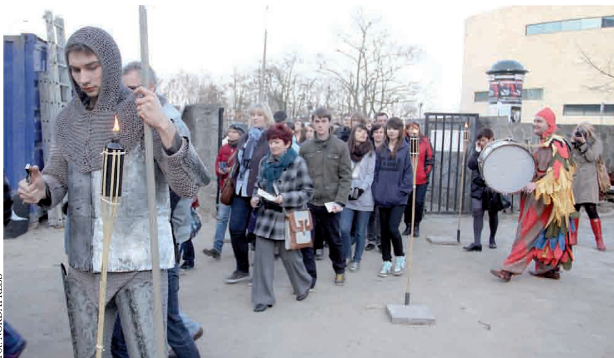
Podróż po Teatrze rozpoczęła się wejściem widzów przez bramę od strony morza