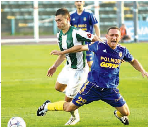
W rundzie jesiennej Arka zremisowała w Grudziądzu 0:0

To właśnie Olimpia będzie kolejnym rywalem Arki Gdynia. Sobotnia konfrontacja zapowiada się niezwykle interesująco, ale to żółto-niebiescy są zdecydowanym faworytem tego meczu. Początek meczu o godzinie 17.30. W pierwszym pojedynku tych drużyn padł bezbramkowy remis, a piłkarze głównie narzekali na okropny upał, który uniemożliwił im płynne prowadzenie akcji. Tym razem nic takiego mieć miejsca nie będzie a rozpędzona Arka, pokrzepiona awansem do półfinału Pucha-