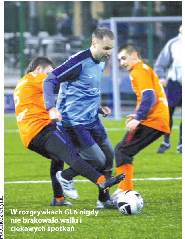
W rozgrywkach GL6 nigdy nie brakowało walki i ciekawych spotkań.

- Rozgrywki planujemy zakończyć w połowie czerwca – ponownie informuje Faltyński. – Być może zakończenie rozgrywek połączymy ze wspólnym oglądaniem spotkania Polski w trakcie EURO 2012. Patronat nad rozgrywkami ponownie objął Express Gdyni.