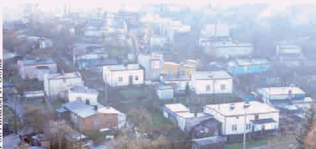
Istniejący do dzisiaj - w centrum dzielnicy Grabówek - Pekin

wiek standardów baraków i bud. Mieszkało w nich – bagatela! - blisko 30 procent mieszkańców miasta i to niekoniecznie bezrobotnych, ale marynarzy, drobnych handlowców, rzemieślników, robotników portowych, a nawet początkujących urzędników. Dzielnice biedy Stara Warszawa, Meksyk, Pekin i inne były często siedliskiem nie tylko chorób, ale też miej-