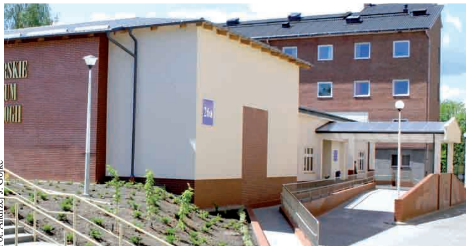
Z pieniędzy RPO sfinansowano m.in. rozbudowę części zabiegowej Gdyniejskiego Centrum Onkologii przy Szpitalu Morskim im. PCK w Gdyni wraz z zakupem sprzętu

Prognozy Instytutu Badań nad Gospodarką Rynkową, zawarte w dokumencie „Wpływ realizacji inwestycji finansowanych z funduszy unijnych na kształtowanie się głównych wskaźników dokumentów strategicznych”, potwierdzają, że województwo pomorskie należy do grupy regionów, które najbardziej efektywnie korzystają z pomocy unijnej. W ocenie Instytutu Badań nad