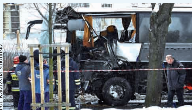
Autokar stanął w poprzek jezdni blokując ją całkowicie

czasie pojazdy kierowano na objazdy ulicami Wielkopolską i Sopocką. Usunięcie autokaru dodatkowo utrudniał zablokowany układ hamulcowy. Trzeba także było ściąć utrudniające jego usunięcie drzewo. Normalny ruch przywrócony został ok. godz. 16.30. Najprawdopodobniejszą wersją jest, że kierująca Suzuki kobieta wymusiła autokarowi pierwszeństwo, ale przyczyną wypadku zbadają dokładnie policjanci z gdyńskiej drogowki. (ANGO)