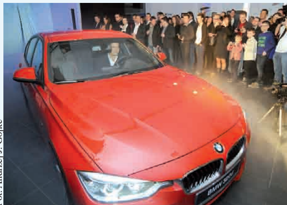
Krzysztof Hołowczyc wjeżdża nowym modelem limuzyny BMW 3

MOTORYZACJA | W salonie BMW Zdunek zaprezentowany został nowy model najmniejszej limuzyny bawarskiej marki BMW 3. Gwiazdą premiery był sam Krzysztof Hołowczyc, a wśród gości znaleźli się m.in. utytułowany żeglarz Piotr Myszkowski i znany paparazzo Przemek Stoppa.